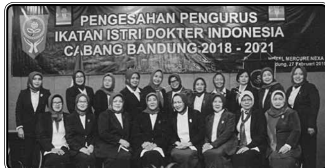
Pengesehan pengurus IIDI Cabang Bandung masa bakti 2018 - 2021

Mensosialisasikan keberadaan dan citra organisasi IIDI kepada masyarakat dengan mendokumentasikan setiap kegiatan yang telah dilaksanakan dalam bentuk album foto dan CD, sumber informasi bagi anggota dan masyarakat pada saat pertemuan rutin dan Bulan Bakti