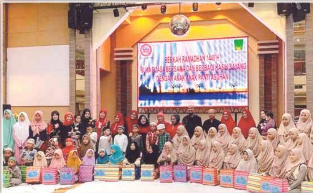
Buka puasa bersama IDI dan IIDI cabang Banjarmasin bersama anak Panti Asuhan