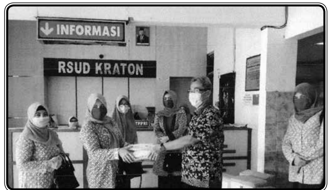
Memberikan bantuan APD dan vitamin kepada RSUD Kraton