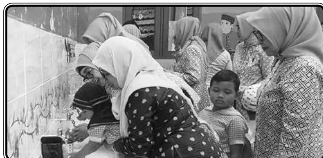
Hari Kesehatan Nasional 2019 : Edukasi PHBS Cara Mencuci Tangan yang Baik dan Benar harus diajarkan sejak dini