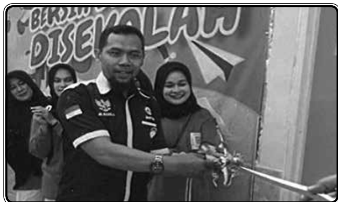
Peresmian toilet bersih, wastafel, toren air dan tempat wudhu di SD Desa Bangun Jaya oleh Wakil Ketua IDI