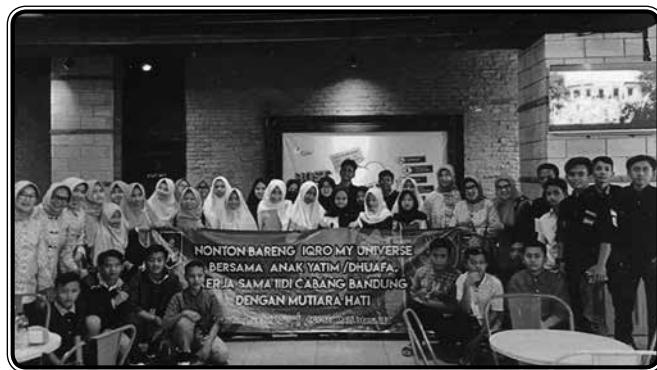
IIDI bekerja sama dengan Majelis Taklim Mutiara Hati mengadakan nonton bareng film "Iqro My Universe" bersama 100 anak yatim dhuafa di Cinema BTC Pasteur