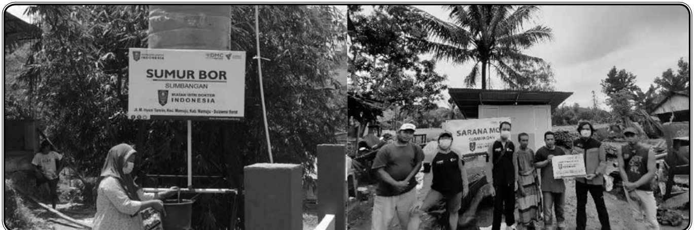
Sumur bor Masjid Baitul Ikhsan Jl. M. Husni Tamrin no. 9, Mamuju. 19 KK, 79 jiwa.