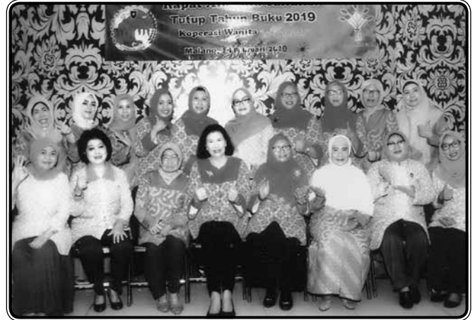
Foto saat RAT 2019 Pengurus Koperasi Kinanti, Pengurus IIDI dan ibu Ketua 2 Kelompok Anggota Koperasi Kinanti IIDI Cabang Malang

Mataram, memberikan sumbangan dana untuk korban bencana alam di Palu melalui Pengurus Besar IIDI.