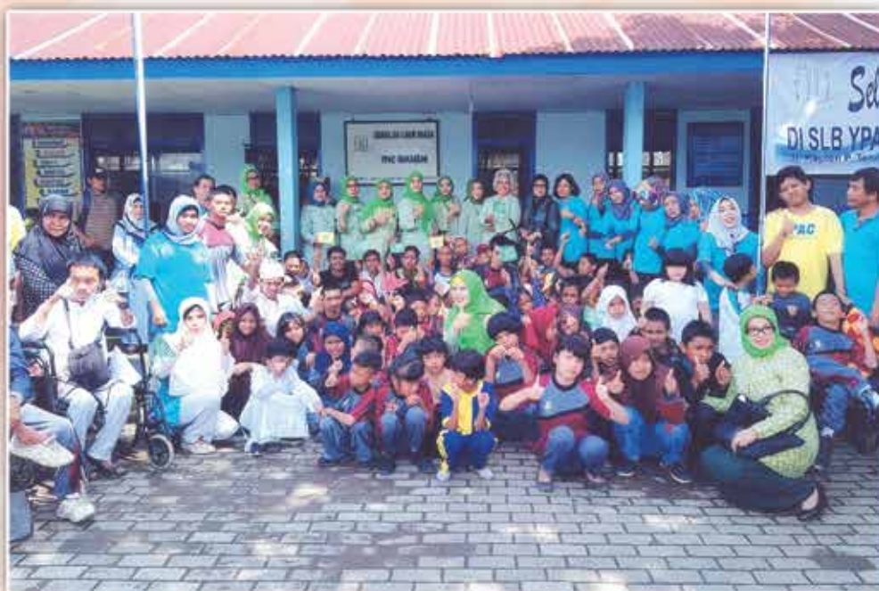
Peringatan HUT IIDI ke-64 dan Hari Ibu ke-90 bersama Yayasan Pembinaan Anak Cacat (YPAC) Makassar