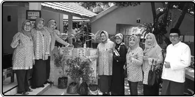
Peresmian tempat cuci tangan sumbangan dari IIDI Cabang Kota Bogor di SDN Sindangsari Bogor dalam rangka Bulan Bakti Istri Dokter (22 Oktober 2019)