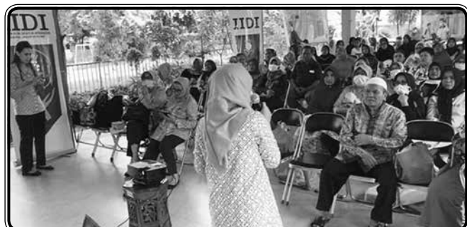
Program Kerja Unggulan IIDI tentang Sosialisasi Pencegahan Penyakit Menular : Kesiapsiagaan dan Pencegahan Penularan Covid-19 di RPTRA Borobudur