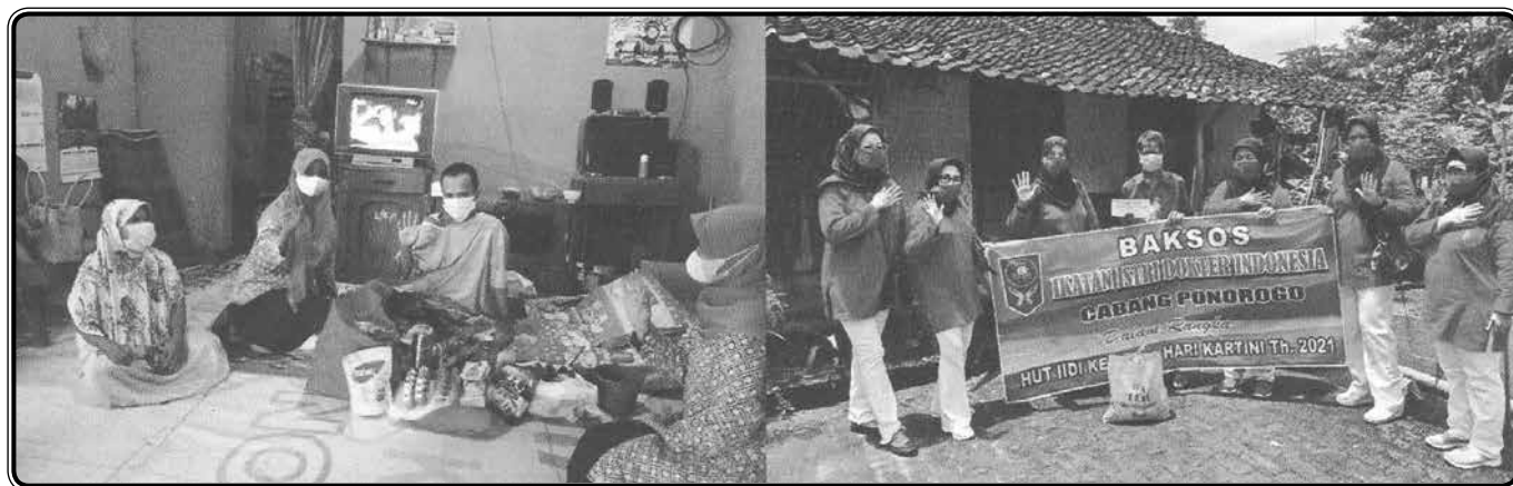
Pemberian makanan tambahan dan paket sembako untuk pasien TBC

Sehubungan dengan hal tersebut IIDI Cabang Ponorogo merasa terpanggil untuk ikut berperan dalam rangka eliminasi TBC tahun 2030. Dalam hal ini tentunya kita tidak berjalan sendiri melainkan dengan bersinergi dengan organi lain. IIDI Cabang Ponorogo bersinergi dengan Pimpinan Daerah 'Aisyiyah Ponorogo yang mendapatkan dana dari Global Fund dalam Program Penanggulangan TBC. Kegiatan Penanggulangan TBC ini sudah masuk ke program kerja IIDI Cabang Ponorogo berupa Pemberian Makanan Tambahan (PMT) untuk pasien TBC dan Bedah Rumah untuk pasien maupun mantan pasien TBC yang tidak mampu.