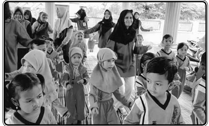
HUT IIDI ke 64 tahun melaksanakan kunjungan ke PAUD Melati Kec. Jogoroto. Dengan acara lomba mewarnai, senam bersama, pembagian makanan sehat dan souvenir sikat gigi plus pasta gigi

Mensosialisasikan keberadaan dan citra Organisasi IIDI kepada masyarakat dengan mendokumentasikan setiap kegiatan IIDI, sumber informasi bagi anggota dan masyarakat, menyebarkan kegiatan IIDI melalui media elektronik : Radio Suara Pendidikan Jombang dengan mengisi acara Interaktif Talk Show Klinik Keluarga Radio Suara Pendidikan dipandu oleh narasumber anggota IIDI Cabang Jombang sesuai dengan kompetensi keilmuan yang dimiliki, dan memvisualisasikan / menyebarkan hasil kegiatan IIDI melalui media cetak / Koran Lokal Radar Mojokerto.