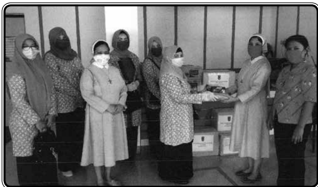
Memberikan bantuan APD dan vitamin kepada RSU Budi Rahayu