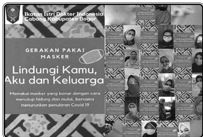
Membuat promosi kesehatan "Gerakan Pakai Masker" di media sosial semua anggota IIDI Cabang Kabupaten Bogor