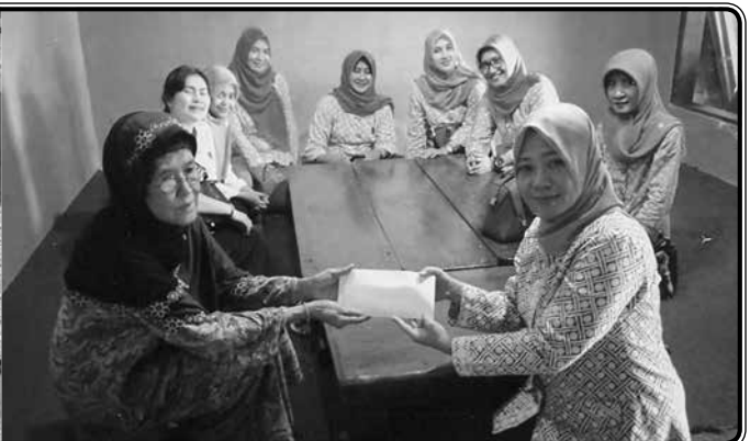
Bakti sosial bulan suci Ramadhan menyalurkan zakat maal anggota ke beberapa Panti Asuhan, Panti ODGJ dan kaum dhuafa.