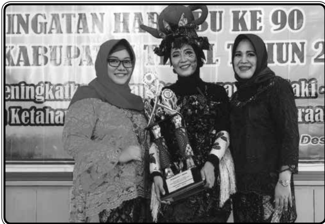
IIDI Kabupaten Tegal mendapat juara favorit dalam lomba batik karnival dalam rangka Hari Ibu ke-90 tanggal 20 Desember 2018 bersama peraga dan narator lomba batik karnival