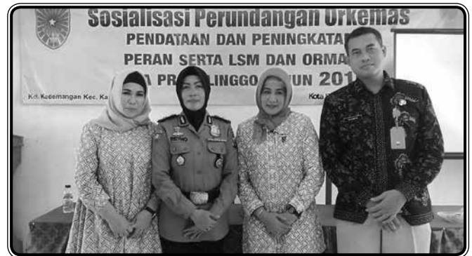
Menghadiri sosialisasi Perundangan Orkemas, pendataan dan peningkatan, peran serta LSM dan ORMAS oleh KESBANGPOLINMAS pada tanggal 19 November 2019

Mengupayakan kesejahteraan anggota IIDI dan keluarga dengan memberi perhatian kepada anggota yang sakit / mendapat musibah, melahirkan dan lain-lain, menyalurkan/memberikan uang duka dan beasiswa kepada putra putri anggota IIDI, mengadakan pengajian rutin, memperingati hari besar agama.