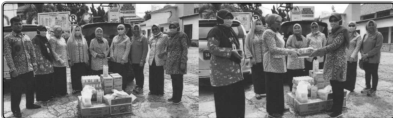
Penyerahan bantuan COVID-19 ke RS Semen Padang dan RS M. Djamil Padang

Kegiatan IIDI Cabang Padang cukup baik. Semoga dimasa yang akan datang dapat ditingkatkan lagi dan lebih teliti membuat Laporan Kegiatannya. Tetap kompak dan tetap semangat... ✍