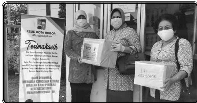
Penyerahan bantuan APD dari IIDI Cabang Kota Bogor ke RSUD Kota Bogor dalam rangka Bakti Sosial Covid-19 ( 8 Mei 2020 )