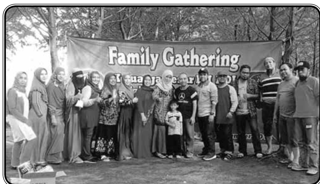
Family gathering dan peringatan HUT IIDI di pantai Ngudel, Malang Selatan tanggal 8 Desember 2019