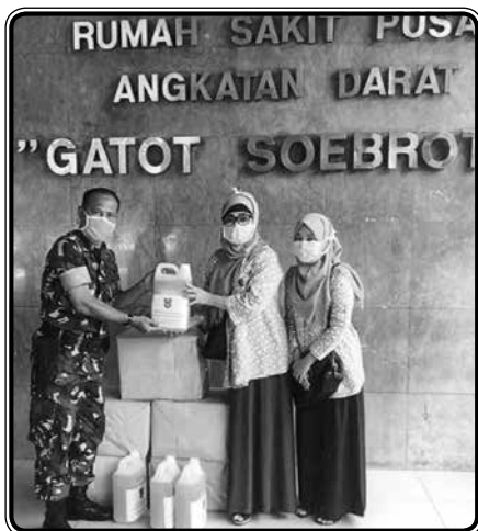
Penyerahan bantuan APD kepada tenaga kesehatan di RSPAD Gatot Soebroto Jakarta Pusat

Turut berperan serta dalam mencerdaskan anak bangsa melalui program anak asuh dan wajib belajar yaitu dengan memberikan beasiswa kepada siswa berprestasi di Kelurahan Menteng 1x setahun, membina PAUD Dahlia dengan memberikan bantuan moril dan materiil secara berkala.