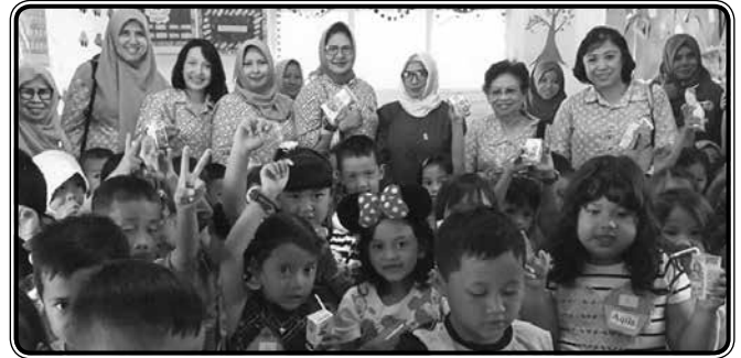
Kunjungan ke TK Alita binaan POW Kota Bogor ( 18 Juli 2019 )

IDI Kota Bogor dan Pengurus Besar IIDI. Memberikan dukungan sumbangan kepada petugas kebersihan Wanita di Kota Bogor dalam peringatan Hari Ibu ke-91.