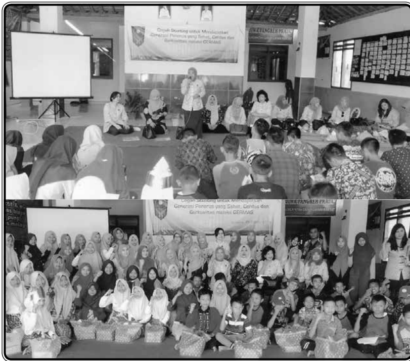
Kegiatan Bulan Bakti IIDI 2019 di Posyandu Remaja Desa Marmoyo Kec. Kabuh, Kab. Jombang dengan tema Cegah Stunting untuk Mendapatkan Generasi Yang Sehat, Cerdas dan Berkualitas Melalui GERMAS