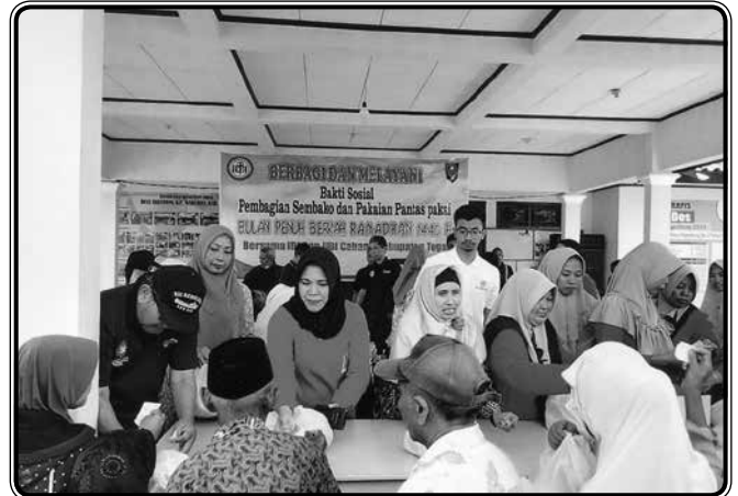
Baksos ramadhan bekerjasama dengan IDI Kabupaten Tegal di desa Sigentong Warureja Kabupaten Tegal, tanggal 19 Mei 2019, pembagian sembako dan pakaian pantas pakai