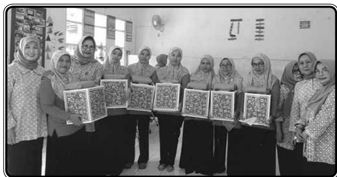
Pembagian bingkisan lebaran untuk lansia, kader posyandu dan warakawuri di Gedung SKS IIDI Cabang Kota Bogor (17 Mei 2019)