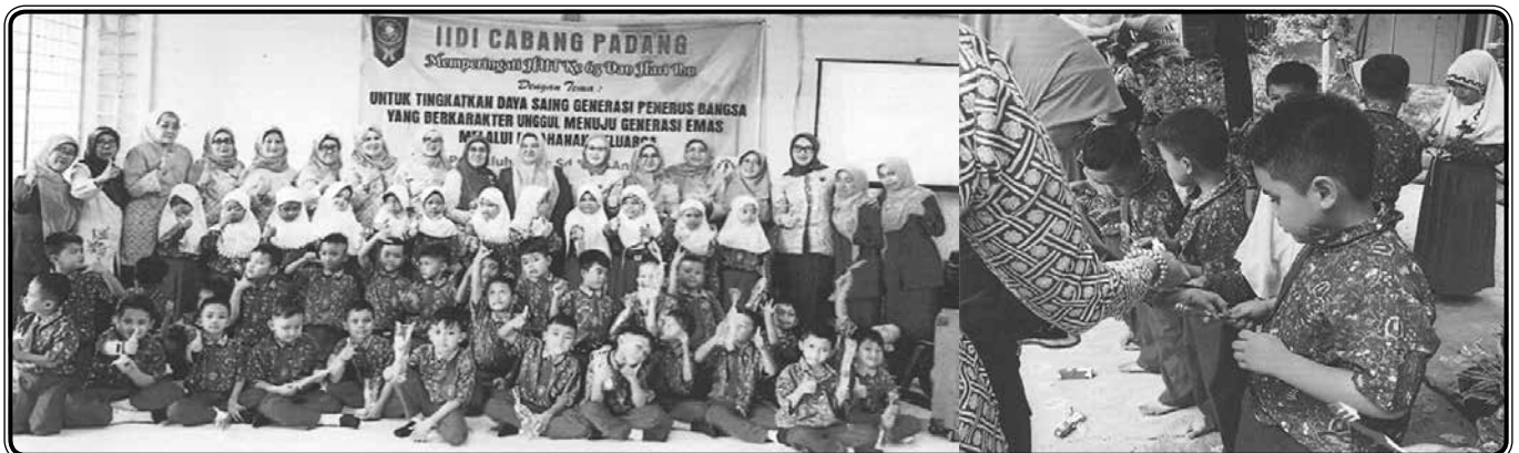
Kegiatan bulan bakti berupa kunjungan dan penyuluhan berupa perawatan gigi dan mulut ke SD Dian Andalas