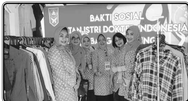
Mengikuti bazar kemerdekaan RI ke-74 di RS Hasan Sadikin Bandung, dengan menjual barang bekas layak pakai