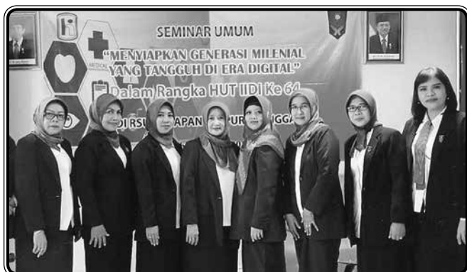
Ulang Tahun IIDI ke 64 dan Seminar Menyiapkan Generasi Milenial yang Tangguh di Era Digital