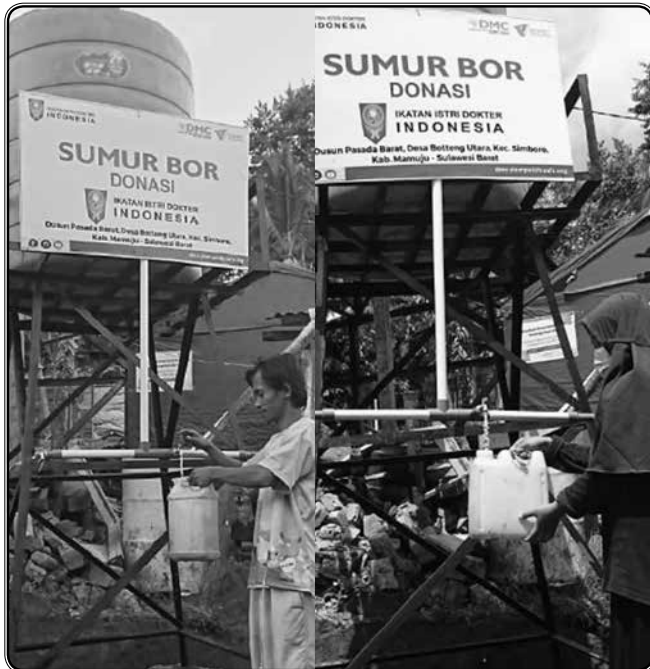
Sumur bor Dusun Pasada Barat, Desa Botteng Utara, Kec. Simboro, Mamuju. 109 KK / 460 Jiwa.