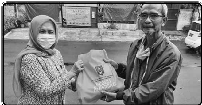
Pembagian sembako untuk Pemulung, Driver Ojol, Asisten Rumah Tangga dll dalam rangka bakti sosial COVID-19 (Mei - Juni 2020)