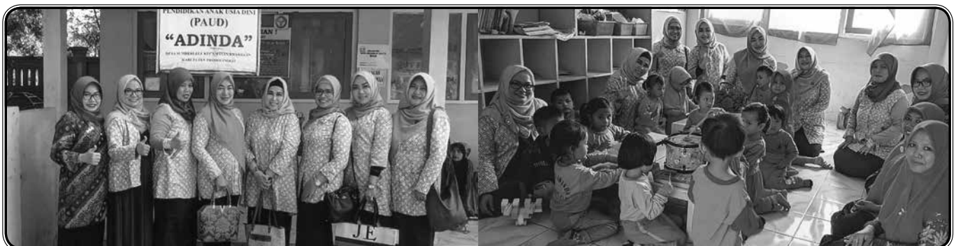
Pemberian bantuan peralatan menggambar dan tas sekolah serta pemberian gizi susu, snack, minuman kepada PAUD Adinda