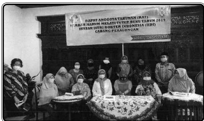
Rapat Anggota Tahunan Koperasi Berkah Harum Melati