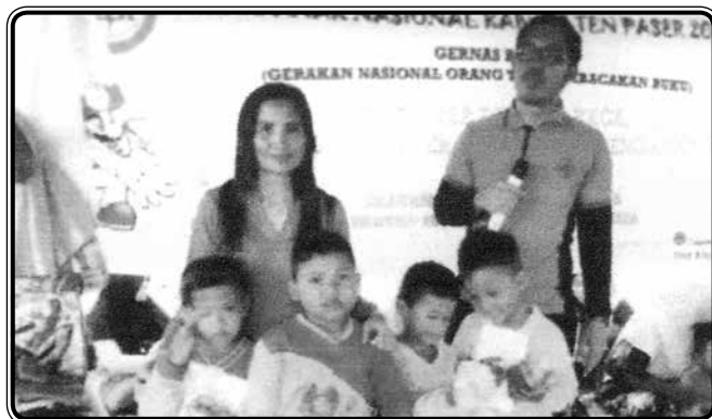
Bersama IDI mengikuti Lomba Dongeng dalam rangka Hari Anak Nasional Tahun 2018 dan mendapat Juara 3