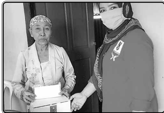
Penyerahan bingkisan sembako IIDI kepada lansia sebagai korban terdampak langsung pandemi COVID-19