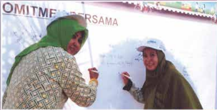
IIDI Cabang Kuningan

Penandatanganan komitmen bersama dengan seluruh organisasi dalam memasyarakatkan GERMAS di halaman pendopo Kabupaten Kuningan