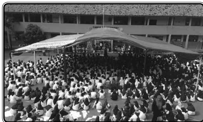
Memberikan penyuluhan kesehatan kepada 1000 orang lebih pelajar SMP di SMPN 1 Citireup pada minggu ke III BBID 2019.