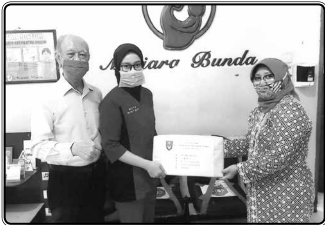
Penyerahan bantuan alat kesehatan COVID-19 di RSIA Mutiara Bunda

Turut berperan serta dalam menanggulangi korban bencana alam dengan memberikan bantuan dana untuk korban bencana di Lombok melalui IIDI Cabang