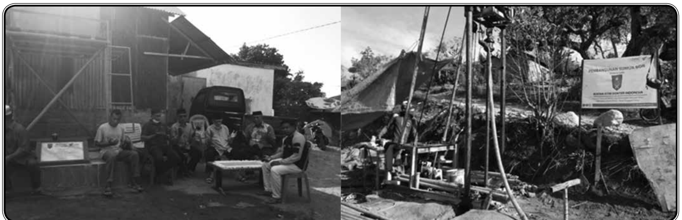
Sumur bor Masjid Baitul Ikhsan Jl. M. Husni Tamrin no. 9, Mamuju. 19 KK, 79 jiwa.

Alhamdulillah, puji syukur kepada Allah,.. semua kegiatan Bidang Kesejahteraan Sosial selama tahun 2020 - 2021 berjalan lancar, sesuai rencana dan diharapkan juga tepat sasaran. Semoga Bidang Kesejahteraan Sosial sebagai bagian dari IIDI menjadi bagian dari membangun masyarakat Indonesia menjadi lebih baik lagi. ✍