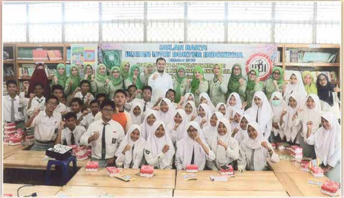
Foto bulan bakti IIDI pemeriksaan HB dan penyuluhan di SMAN 13 Banjarmasin