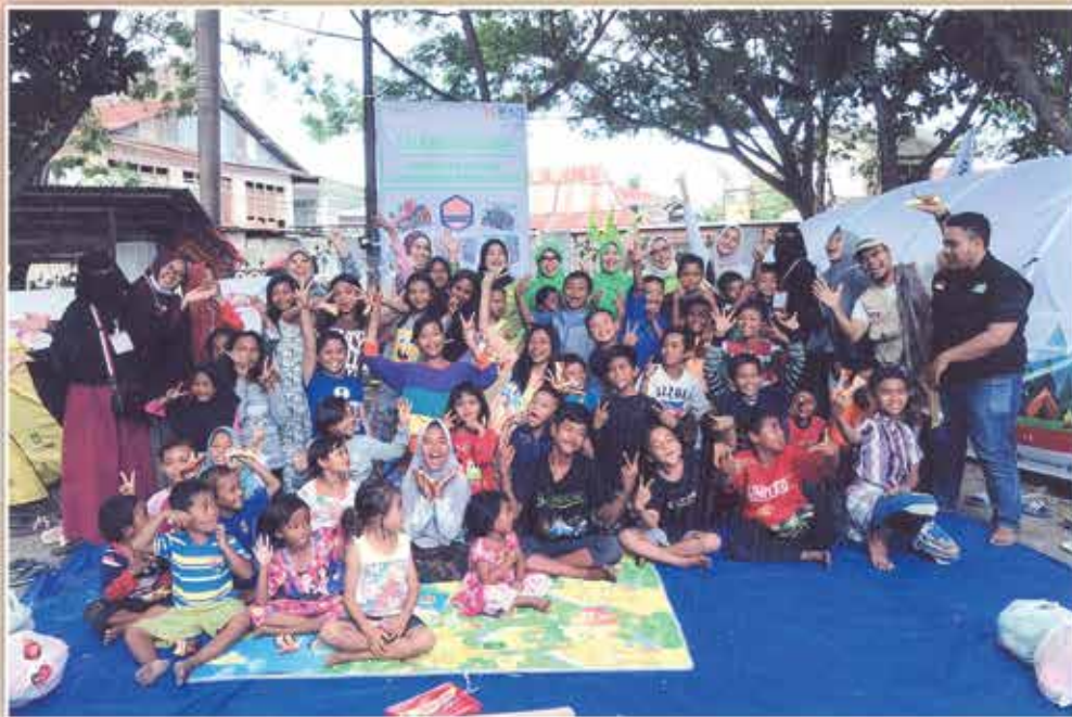
IIDI Cabang Makassar Peduli Korban Gempa dan Tsunami Palu, Kegiatan Trauma Healing bagi anak-anak korban bencana