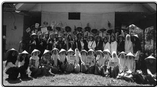
Foto bersama saat mengadakan Workshop Entrepreneurship bagi pelajar SMA di kampung wisata bisnis Tegal Waru