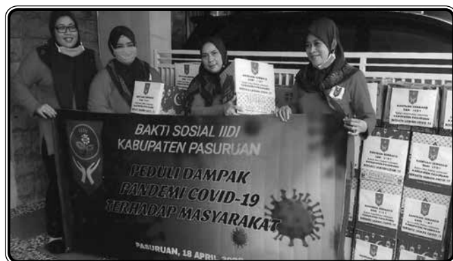
Bakti sosial peduli dampak pandemi COVID-19 pada tanggal 18 April 2020