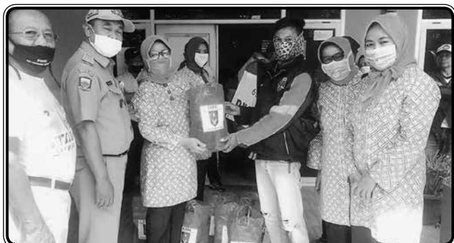
Baksos 55 paket sembako ke kelurahan Sukapura dan Kelurahan Sekejati untuk pegawai kelurahan, hansip dan ojek pangkalan