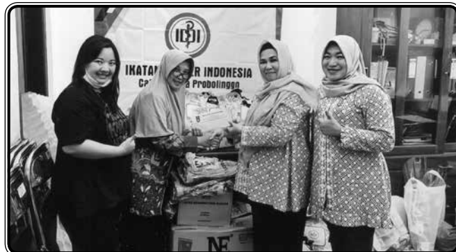
Pemberian bantuan keuangan melalui IDI untuk pembelian Alat Pelindung Diri (APD) untuk tenaga kesehatan di Probolinggo pada tanggal 30 Maret 2020

Mencari Donatur disesuaikan dengan keperluan sasaran dari Sponsor dan Anggota.