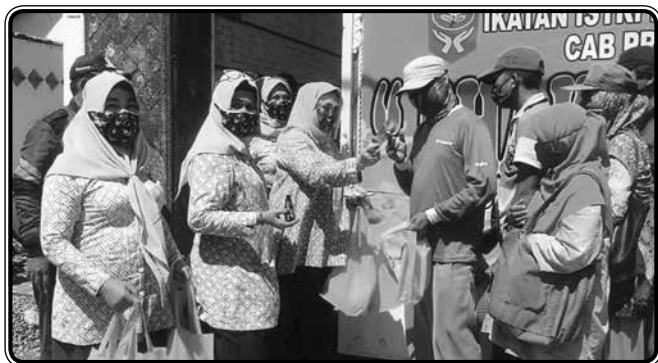
Bakti Sosial memberikan sumbangan berupa makanan dan uang kepada kaum dhuafa tukang becak