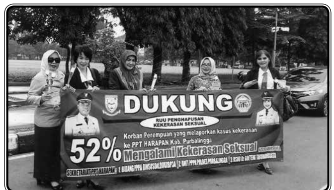
Dukung RUU Penghapusan Kekerasan Seksual