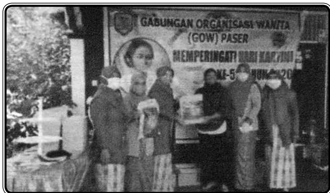
Memberikan bantuan kepada orang tidak mampu dalam rangka Hari Kartini (2020)

Meningkatkan pengetahuan masyarakat khususnya mengenai pendidikan kesehatan dengan mengadakan seminar kesehatan selama berpuasa, penyuluhan tentang stunting , penyuluhan tentang pentingnya cuci tangan di era covid-19 untuk anggota IIDI, meningkatkan pengetahuan kader dengan ilmu tumbuh kembang anak dan nutrisi untuk balita, penyuluhan KDRT di lingkungan Kecamatan Tanah Grogot. Selain itu, IIDI Cabang Paser juga mensosialisasikan jam wajib belajar (19.00 - 21.00 WITA).