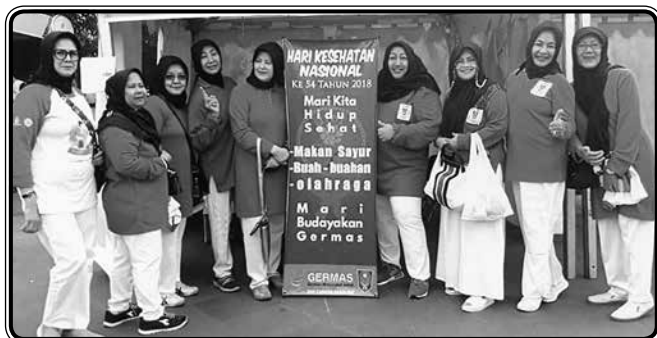
Menghadiri Deklarasi Nasional Pencegahan Stunting oleh Gubernur Jawa Barat Ridwan Kamil di lapangan Gasibu Bandung, IIDI Cabang Bandung sebagai perwakilan mitra strategis, dengan membagikan sayur-sayuran dan buah-buahan gratis