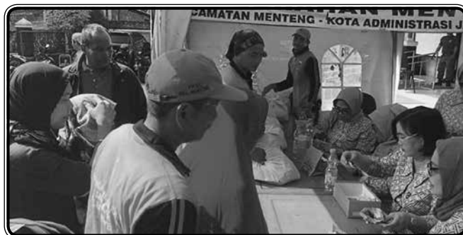
Dalam rangka bulan suci Ramadhan 1440 H penjualan 1200 paket sembako murah di Kelurahan Menteng Jakarta Pusat