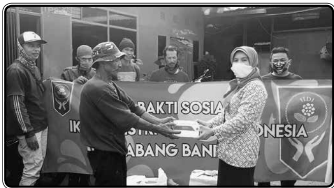
Baksos ke kelurahan Antapani : 18 paket ke tempat pembuangan sampah Antapani Kidul, 8 paket ke tempat pembuangan sampah Antapani Tengah, 15 paket ke tempat pembuangan sampah Antapani Wetan, 8 paket untuk tukang gali dari Majalengka.