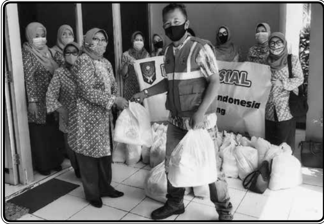
Memberikan paket sembako kepada tukang parkir, tukang becak, pemulung sampah, janda tidak mampu, perawat usia > 98 tahun