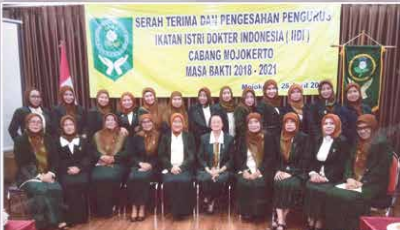
IIDI Cabang Mojokerto