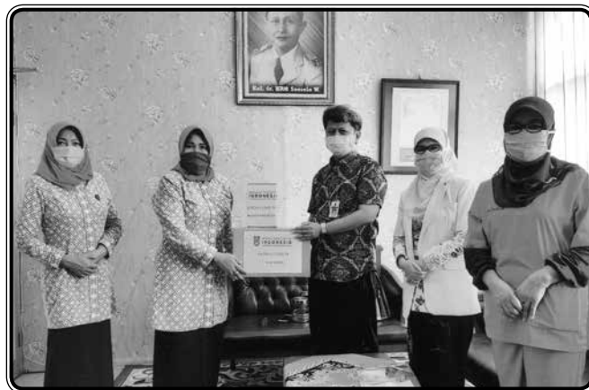
Penyerahan bantuan berupa APD kepada tenaga medis, 2 April 2020