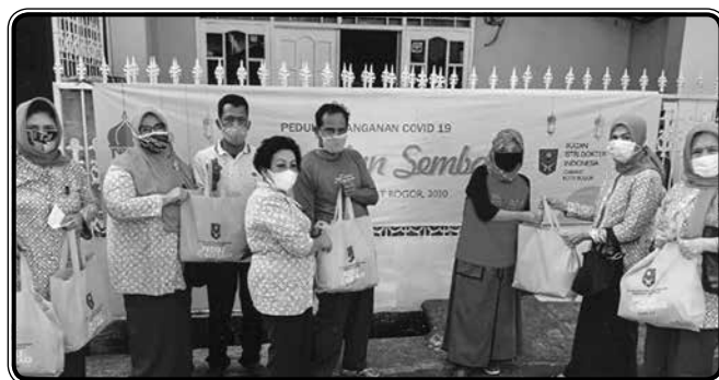
Membagi sembako dalam rangka Bakti Sosial Covid-19 di Kampung Kramat (10 Mei 2020)