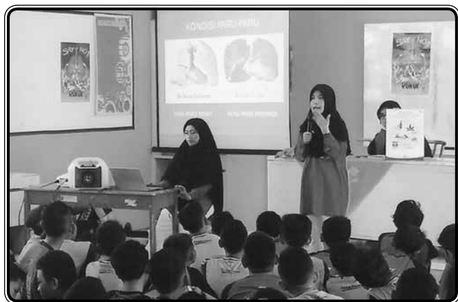
Penyuluhan bahaya merokok dan napza kepada siswa SMP 1 Balapulang, BBID Oktober 2019