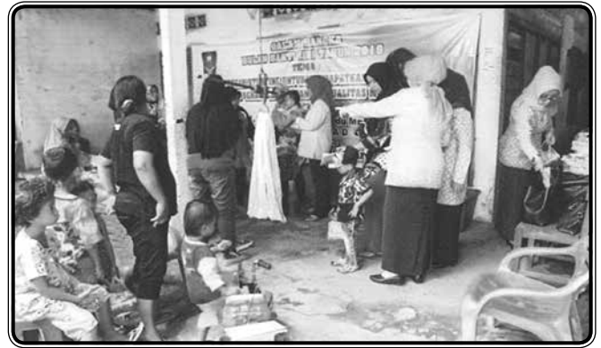
Memberikan makanan sehat di posyandu MEKAR Lapai

Pembinaan hubungan keluar dilaksanakan dengan menjalin komunikasi dan hubungan baik dengan instansi pemerintah, antara lain menjalin Kerjasama dengan Dinas Pendidikan Kota Padang dan Provinsi Sumatra Barat dalam rangka merealisasikan program kerja unggulan IIDI, menghadiri undangan dan kegiatan yang diadakan oleh Pemerintah Kota Padang atau Propinsi Sumatra Barat dan organisasi wanita lain yang mempunyai tujuan sama, menjalin kerjasama dengan GOW Kota Padang dan BKOW Provinsi Sumatera Barat, antara lain dengan mengikuti konsolidasi organisasi yang diadakan oleh BKOW Provinsi Sumatera Barat.