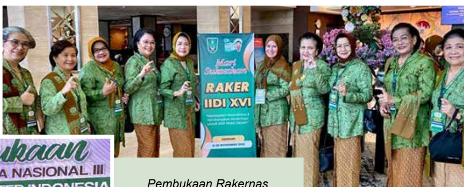
Pembukaan Rakernas IDI III dan Raker IIDI XVI Tahun 2023