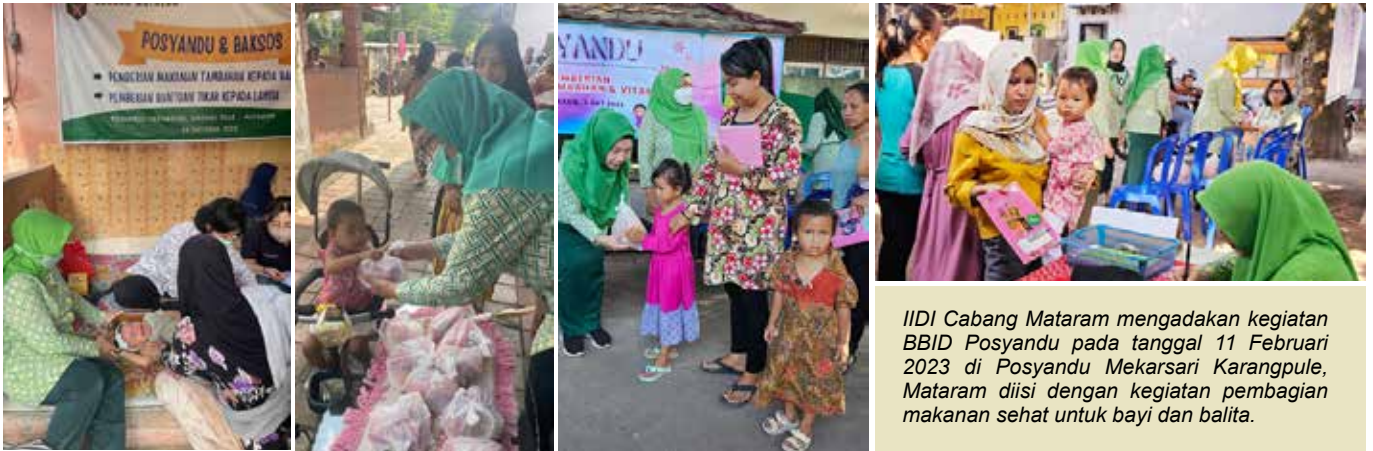
IIDI Cabang Mataram mengadakan kegiatan BBID Posyandu pada tanggal 11 Februari 2023 di Posyandu Mekarsari Karangpule, Mataram diisi dengan kegiatan pembagian makanan sehat untuk bayi dan balita.