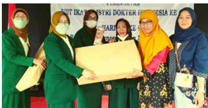
Bantuan alat kesehatan untuk PKK Sewon