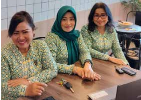
IIDI Cabang Kabupaten Sambas mengikuti zoom seri 2