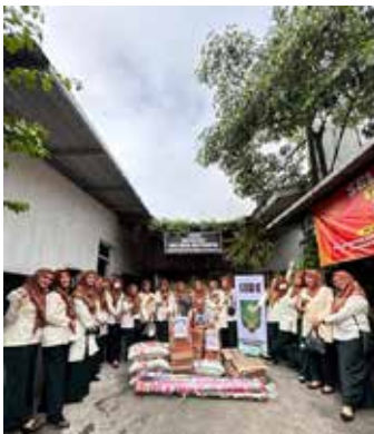
Bakti sosial Ramadhan mengadakan kunjungan untuk memberikan santunan ke Panti Jompo Welas Asih, memberi Kulkas, beras dan lain-lain. (Foto kiri atas)