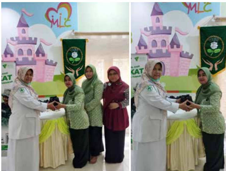
Kolaborasi IIDI dengan Klinik My Lovely Child Puskesmas Padang Pasir dan Dompot Dhuafa Singgalang 21 Maret 2023 di Klinik My Lovely Child