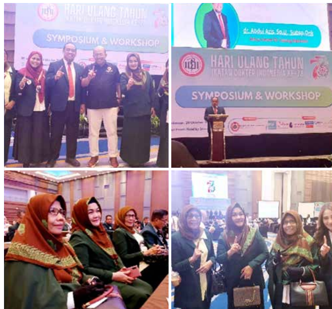
Menghadiri HUT IDI Ke-73 di Kota Makassar : IIDI Cabang Makassar berfoto bersama Bapak Ketua Umum PB IDI, Ketua IDI Kota Makassar pada tanggal 29 November 2023.