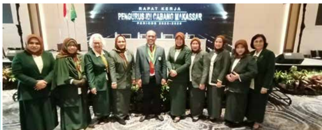
Menghadiri acara Pelantikan IDI Cabang Kota Makassar Periode 2023 - 2026