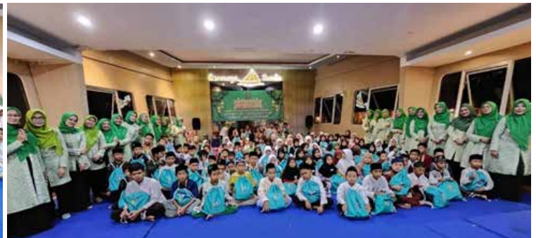
Buka puasa bersama 150 anak yatim piatu.