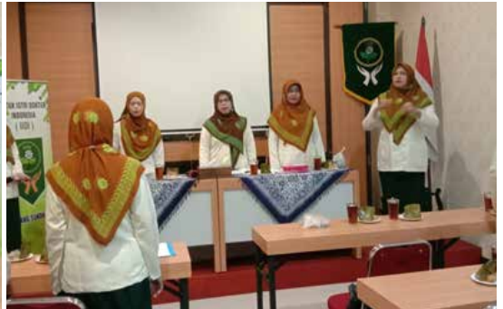
Menyanyikan Hymne IIDI. (Foto kanan atas)