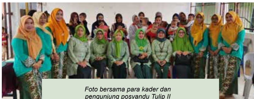
Foto bersama para kader dan pengunjung posyandu Tulip II