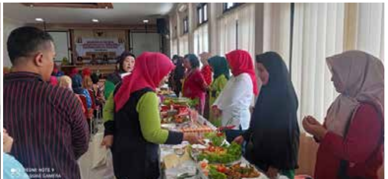
Dalam rangka menggaungkan Cegah Stunting itu Penting, IIDI Boyolali turut berpartisipasi memeriahkan HUT GOW ke-60 dengan mengikuti lomba memasak ikan lele. (kanan)