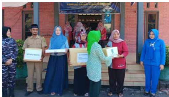
Peresmian Kampung Bahari Nusantara TNI AL

Kegiatan IIDI Cabang Yogyakarta dalam rangka HUT IIDI ke-68 Tahun 2022 dengan tema IIDI Bersinergis Mencegah dan Mengatasi Stunting.