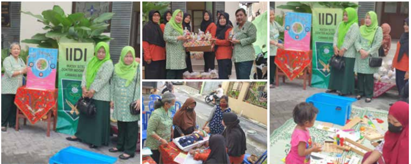
Pada tanggal 6 Mei 2023 diadakan kegiatan di Posyandu Widuri Kerten membagi PMT ke Balita, memantau tumbuh kembang anak dengan melakukan penimbangan berat badan, mengukur tinggi badan dan sosialisasi isi piringku.