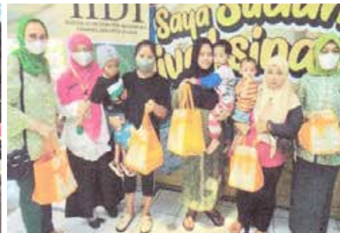
Memberikan makanan tinggi protein hewani serta vitamin kepada 6 anak terindikasi stunting di Puskesmas Kelurahan Pegangsaan. (Foto kiri atas)