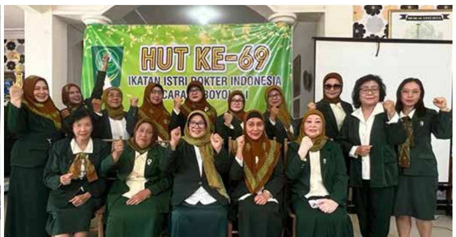
HUT ke-69 IIDI Cabang Boyolali