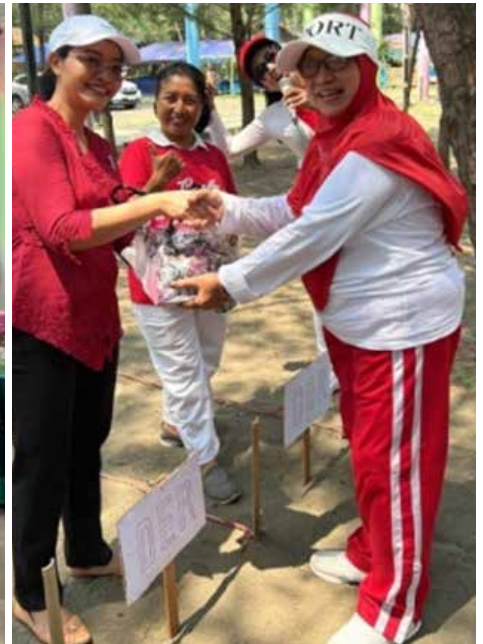
Memperingati HUT RI ke-78 yang diadakan di Pantai Widuri pada kesempatan ini IIDI Cabang Pemalang mengadakan penjualan sembako murah sebanyak 200 paket. (foto atas kanan dan bawah)