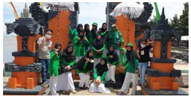
Pertemuan rutin dan arisan bulan Februari 2023 IIDI Cabang Indramayu telah terlaksana pada hari Selasa, 14 Februari 2023 bertempat di Pantai Tirta Ayu, Balongan