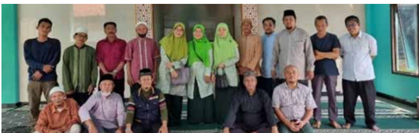
Santunan untuk marbot Masjid RTQ Al Khoir, Babar Laya, Desa Terusan Indramayu sebanyak 14 orang