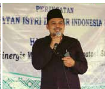
Penyuluhan Elsimil untuk warga Sewon oleh kepala KUA Kapanewon Cangkingan