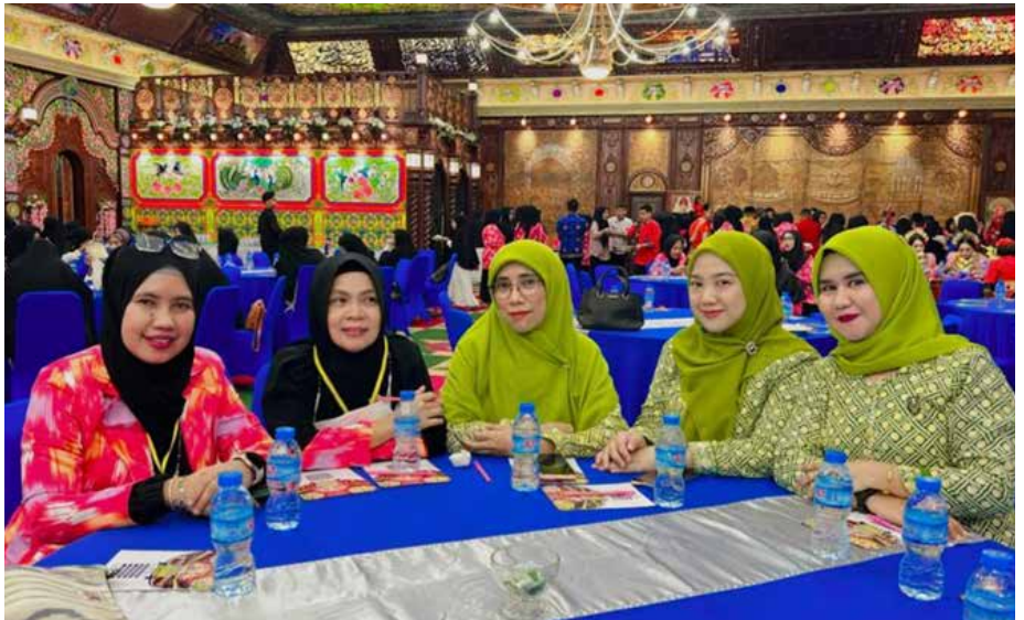
IIDI Cabang Kota Kendari menghadiri kegiatan pembukaan Musyawarah Kerja Ikatan Wanita Sulawesi Selatan (IWSS) Wilayah Kendari yang diadakan pada tanggal 17 Maret 2023 di Hotel Kubah 9 Kendari