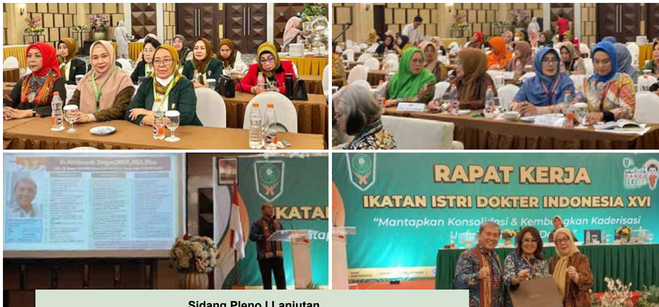
Sidang Pleno I Lanjutan (Ceramah dan Sosialisasi Forum Komunikasi Jawa Tengah I, II dan III)