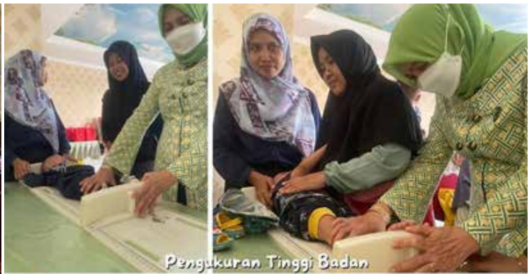
Pengukuran Tinggi Badan