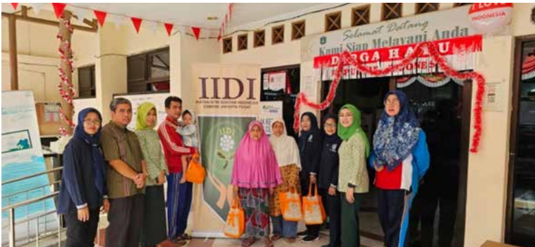
Kegiatan setiap Jumat adalah pemberian makanan tinggi protein hewani terhadap 11 orang anak yang diduga stunting dari Kelurahan Pegangsaan dan Kelurahan Menteng Jakarta Pusat. (Foto kiri atas)