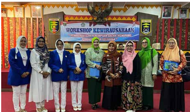
Workshop Lilin Aromaterapi "Meningkatkan Kreativitas Organisasi Wanita Kota Metro" tahun 2023 bersama GOW Kota Metro. Alhamdulillah IIDI Cabang Kota Metro mendapat Juara 3.