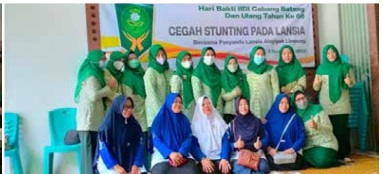
Pemberian Makanan Tambahan (PMT) pada Lansia (2 foto bawah).