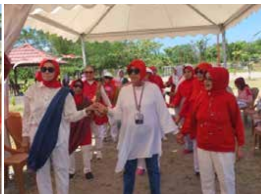
Kegiatan IIDI Cabang Makassar dengan Gathering IIDI Makassar di Pantai Indah Bosowa, dirangkaikan dengan HUT RI ke-78 seru-seruan dengan beberapa lomba, yang diawali dengan Senam Lansia Alhamdulillah kegiatan Outdoor membawa kebahagiaan tersendiri.