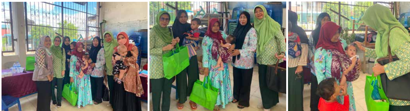
Kunjungan ke Posyandu Tulip II Tiban Lama dalam rangka tindak lanjut BBID yang sudah terlaksana bulan April yang lalu yakni ikut serta mendukung program cegah stunting dengan membagikan beberapa bahan pokok / pangan sebagai penunjang gizi bagi anak-anak yang terdata stunting.