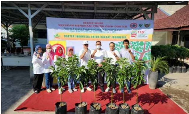
Giat IIDI Cabang Kota Kediri tanggal 27 Mei 2023 bersama IDI dalam rangka Hari Bakti Dokter Indonesia, menanam pohon alpukat di beberapa lokasi, simbolis di halaman Dinkes Kota Kediri, sebagai upaya Cegah Stunting.