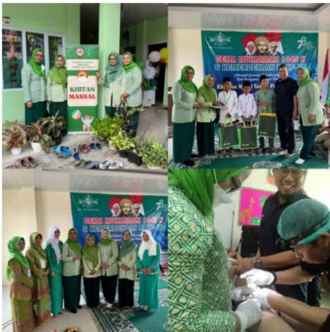
Baksos bersama IIDI Kota Bekasi dalam rangkaian HBDI IIDI Kota Bekasi bertempat di Gedung Jatman NU Kranji Bekasi melakukan khitanan massal.