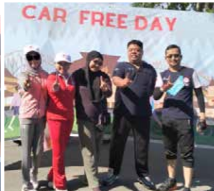
Menyampaikan kegiatan Dalam Rangka HUT IDI yang ke-73, IDI Kabupaten Sambas mengadakan Senam Bersama & Pemeriksaan Kesehatan. (2 foto kiri)