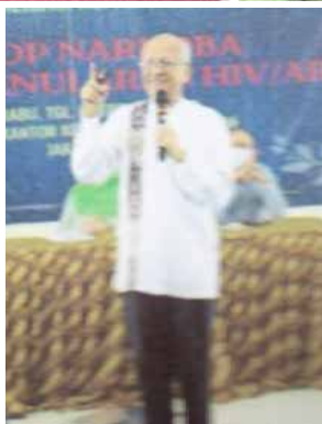
Mengadakan seminar kesehatan Pencegahan & Pengobatan Penyakit Tidak Menular tentang Besar pada Perempuan bekerjasama dengan IDI Cabang Jakarta Pusat, diadakan di Aula RS Brawijaya Saharjo Jakarta Pusat dalam rangka Hari Wanita Indonesia. (2 foto atas)