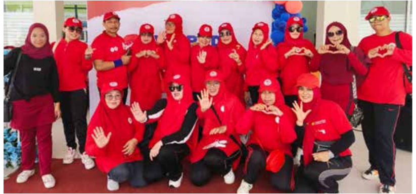
IIDI Cabang Sambas mengikuti Hari Jantung Sehat Sedunia 'HEART WOLK 2023' DI Halaman Gedung Pusat JANTUNG TERPADU Pontianak