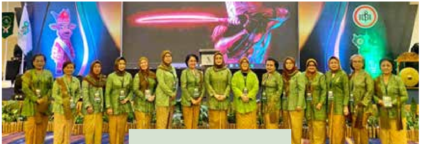
Pembukaan Rakernas IDI III dan Raker IIDI XVI Tahun 2023