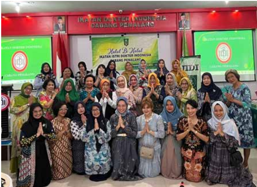
Halal bi Halal yang diadakan di Gedung IDI Pemalang dihadiri 30 anggota. (2 atas kiri)