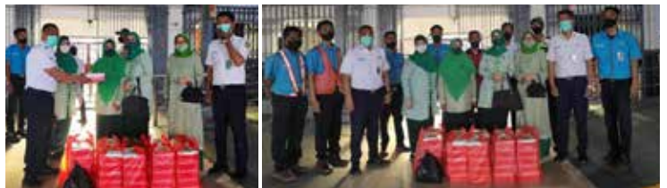
Memberikan nasi box untuk berbuka puasa bagi para porter dan cleaning service di Stasiun Kereta Api Kota Tegal. Dalam kegiatan ini, Ibu-ibu IIDI diterima oleh Kepala Stasiun dan Wakilnya serta perwakilan porter dan cleaning service