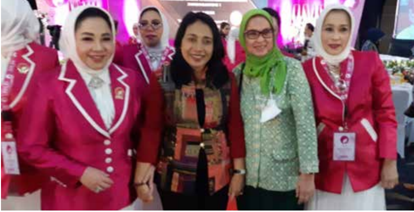
Ketua IIDI Cabang Jakarta Pusat bersama Menteri Peranan Wanita dalam menghadiri undangan P2LIPI. (Foto kiri atas).