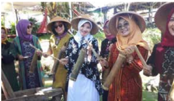
Pertemuan Forkom Solo Raya di Delanggu Klaten berpartisipasi dalam melestarikan kesenian daerah tempo dulu dengan alat musik kentongan dan lesung dengan lagu Ilir-ilir. (Foto kiri)