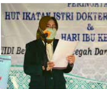
Pembacaan sambutan HUT Ketum PB IIDI oleh Ketua IIDI Cabang Yogyakarta