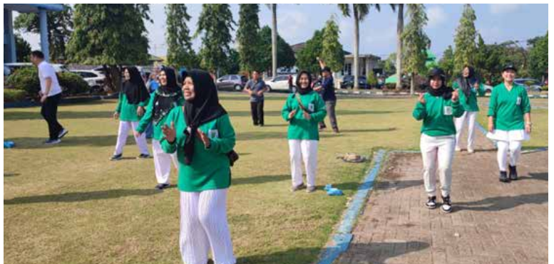
Turut serta memperingati World Stroke Day di RSUD M Yunus Bengkulu, acara di hadiri Direktur RSUD M Yunus, Dokter dan Karyawan RSUD, acara antara lain. Pemeriksaan Darah, Senam Bersama Pasien Stroke dan Senam Jantung Sehat.