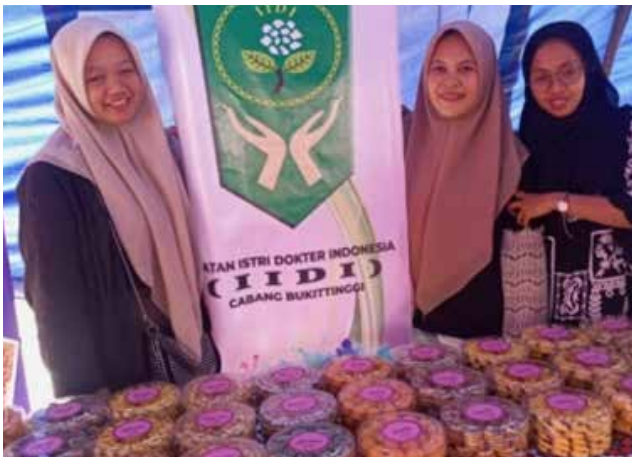
Bazar Ramadhan yang diselenggarakan bersama GOW Kota Bukittinggi tanggal 14 - 16 April 2023 di Pelataran Jam Gadang Kota Bukittinggi.