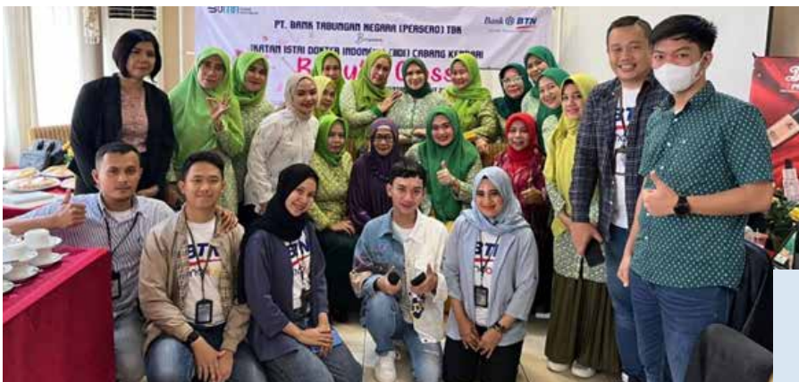
Pertemuan rutin IIDI Cabang Kota Kendari sekaligus kegiatan Beauty Class bersama Bank BTN, LT Pro dan Bengkel Hijab Kendari pada tanggal 10 Maret 2023