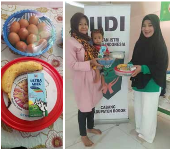
Pemberian isi piringku dan edukasi lanjutan untuk 3 orang anak stunting binaan IIDI Cabang Kabupaten Bogor. (2 foto atas)

Pemberian takjil Ramadhan dan makanan pokok (beras, telur, ayam potong, minyak) untuk Panti Asuhan Ibu Sri di Gunung Putri Kabupaten Bogor. (Foto kanan bawah)