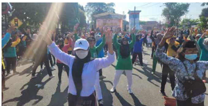
Dalam rangka memperingati hari ibu 22 Desember 2023