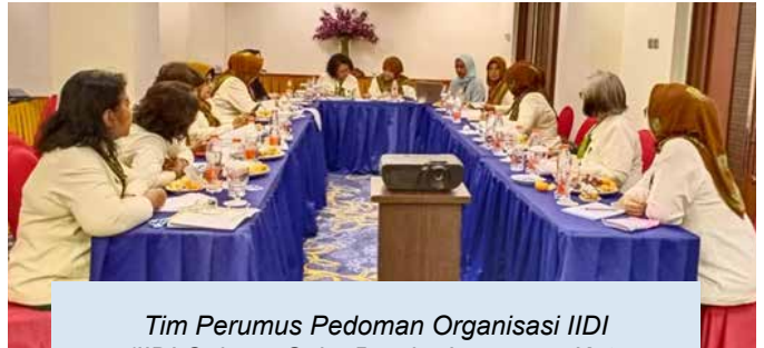
Tim Perumus Pedoman Organisasi IIDI (IIDI Cabang Solo, Bandar Lampung, Kota Bogor, Klaten dan Makassar)