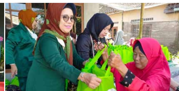
100 paket sembako murah untuk warga Sewon