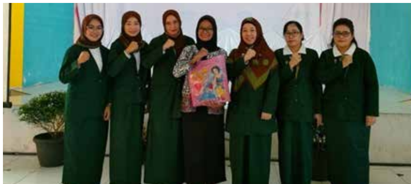
Kunjungan ke SLB bersama Ibu Bupati (Bunda PAUD) HIMPAUDI, DP3AP2KB dalam memperingati HAN 2023 dengan tema "Anak Terlindungi Indonesia Maju". (Foto kanan atas)