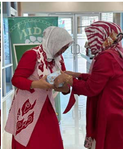
Kegiatan IIDI Cabang Kabupaten Cirebon yaitu pertemuan rutin disertai beberapa lomba ikut memeriahkan Dirgahayu Republik Indonesia ke -78... Merdeka.