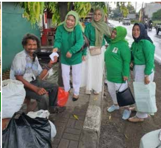
Bakti sosial Ramadhan berbagi dengan anak-anak yatim piatu dan kaum duafa