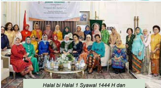
Halal bi Halal 1 Syawal 1444 H dan Peringatan Hari Kartini 2023