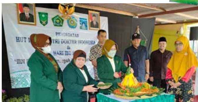
Potong Tumpeng oleh Ketua IIDI Cabang Yogyakarta didampingi Panewu, Lurah & Dukuh setempat