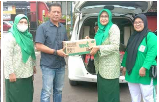
Penyerahan bantuan korban banjir di Kecamatan Grogol Kabupaten Sukoharjo (Foto kanan atas)