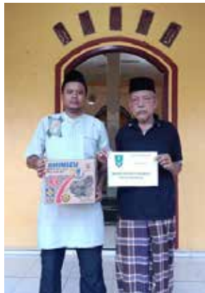
Pemberian santunan kepada anak ABK sebanyak 27 orang @ Rp. 100.000,- (Foto kiri)