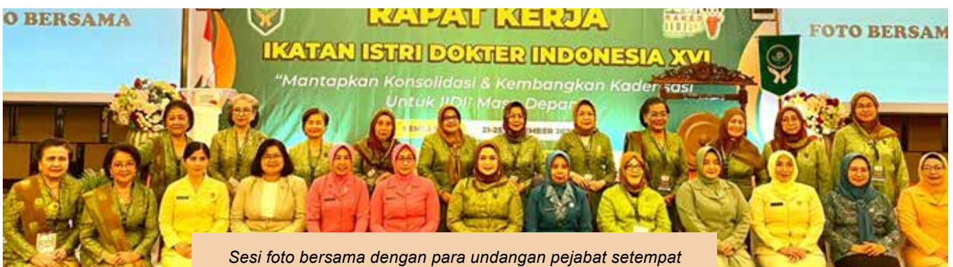
Sesi foto bersama dengan para undangan pejabat setempat