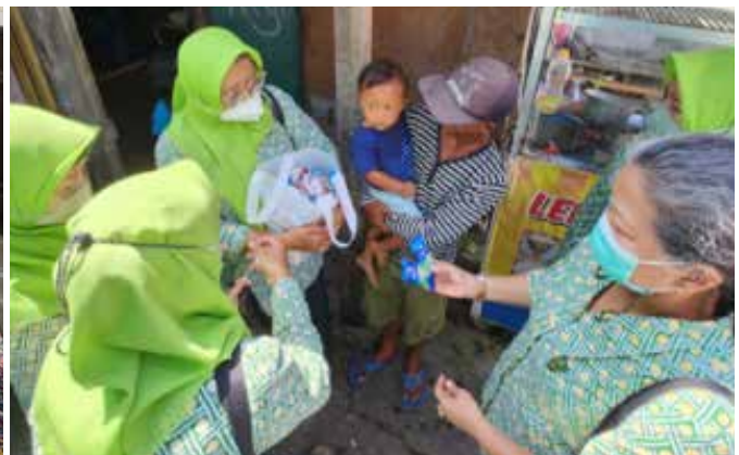
Kunjungan kelanjutan Pendampingan Baduta stunting anak leo di Kelurahan Pajang dengan memberikan PMT serta sosialisasi isi piringku dan memberikan makan yang bervariasi. (Foto kanan)