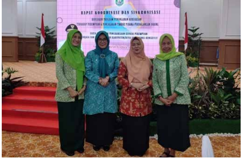
Menghadiri rapat koordinasi dan sinkronisasi kebijaksanaan program penanganan kekerasan terhadap perempuan dan tindak pidana pencegahan perdagangan orang serta pemberian penghargaan perempuan berjasa / berprestasi di Kabupaten Kota se - Provinsi Bengkulu dalam rangka peringatan Hari Kartini.