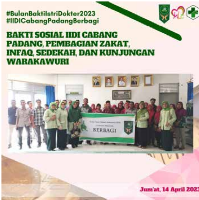
Tanggal 14 April 2023, IIDI Cabang Padang melaksanakan bakti sosial berupa pembagian zakat, infaq, sedekah dan kunjungan warakawuri.