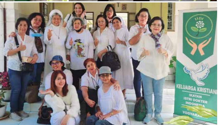
Dalam rangka merayakan Paskah, Keluarga Kristiani IIDI Cabang Yogyakarta mengadakan baksos ke Panti Asuhan Putri Brayat Pinuji Boro