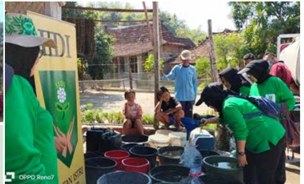
IIDI Cabang Pati dalam Kegiatan Baksos memberikan Bantuan Air Bersih untuk membantu warga yang kekeringan di Desa Trikoyo, Kecamatan Jaken.