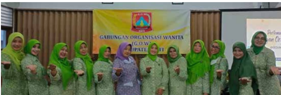
IIDI Cabang Pati bersama GOW sebagai tuan rumah. IIDI Cabang Pati bertugas mengisi acara dengan penyuluhan cuci tangan yang benar dan tentang Hukum Waris dan juga Harta Gono gini.