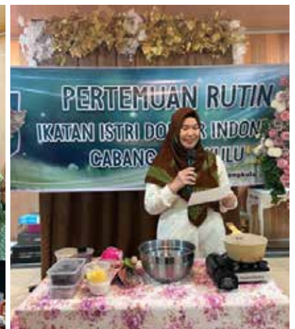
Cooking Class. (Foto kanan)