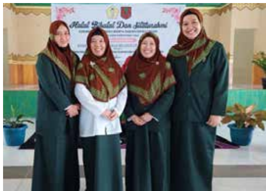
Menghadiri undangan Halal bi Halal dan Silaturahmi GOW Kabupaten Bulungan di Aula Pondok Pesantren Al - Khairaat dirangkai dengan Parenting Talk Problem Solving Pengasuhan Anak di Era Digital dan Dauroh "Peran Perempuan dalam Islam sebagai Teladan dan Tantangan di Era Millenial". (foto kiri atas)