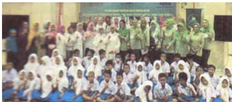
Memberikan goodybag untuk peserta kegiatan Menanamkan Pendidikan Moral dan Budi Pekerti untuk Anak dan Remaja.