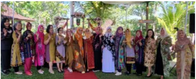
Menghadiri undangan IIDI Cabang Klaten Pertemuan Forkom Solo Raya dan Halal bi Halal. (Foto kanan)