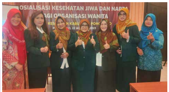
Menghadiri acara Sosialisasi Kesehatan Jiwa yang diselenggarakan oleh Dinas Kesehatan Kabupaten Ponorogo (Foto kanan atas).