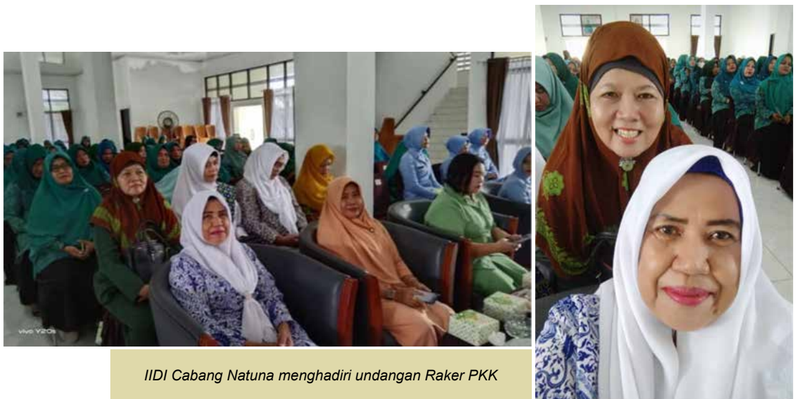
IIDI Cabang Natuna menghadiri undangan Raker PKK