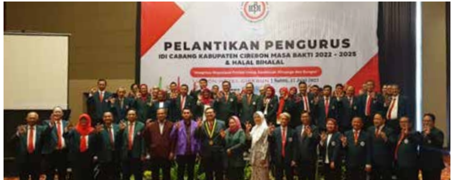
Menghadiri Pelantikan Pengurus IDI Cabang Kabupaten Cirebon