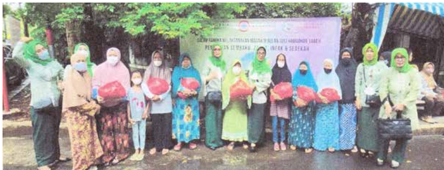
Membagikan sembako, infaq dan sedekah kepada 100 warga Kelurahan Menteng, Jakarta Pusat bersama IIDI dan IDI Cabang Jakarta Pusat. (Foto kanan atas)