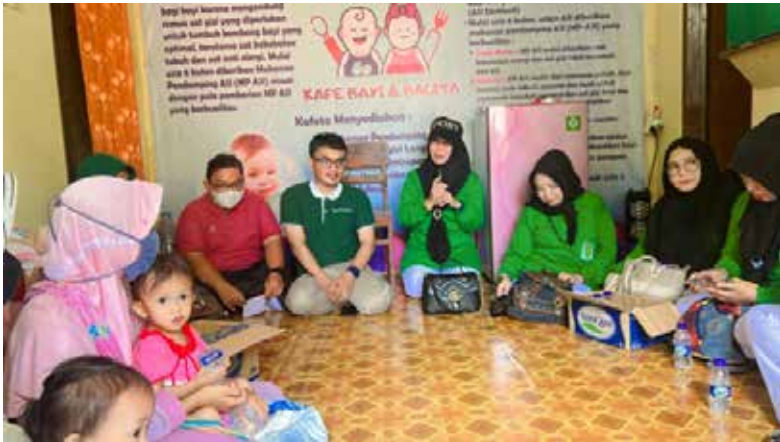
Kunjungan ke Cafeta (Café Bayi dan Balita) Kalisapu dalam rangka Bulan Bakti Istri Dokter Indonesia. (Foto kiri atas).