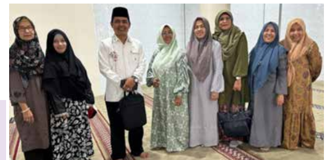
Pada tanggal 14 Desember 2023 mengadakan peringatan Hari Ibu yang ke-95 tahun 2023 dan Ultah Kota Bukittinggi. (Foto kanan dan bawah)