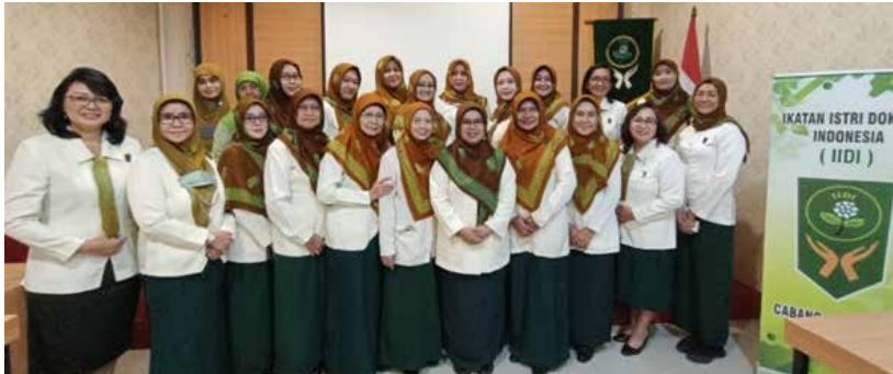
Foto bersama pada pertemuan rutin 14 Maret 2023. (Foto kiri atas)