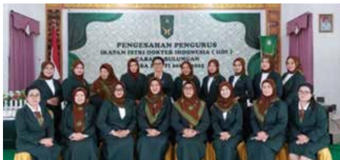
Pengesahan pengurus IIDI Cabang Bulungan masa bakti 2022 - 2025