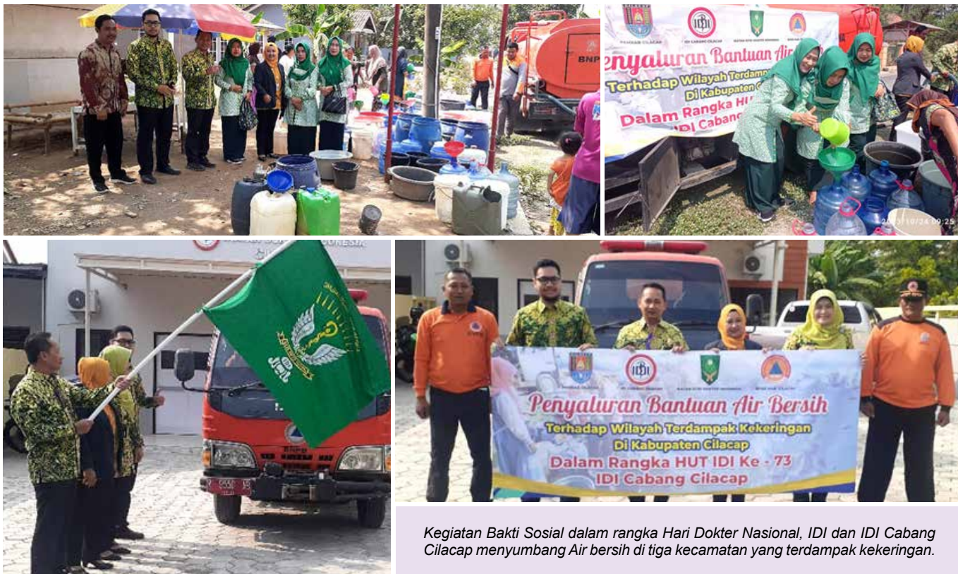
Kegiatan Bakti Sosial dalam rangka Hari Dokter Nasional, IDI dan IDI Cabang Cilacap menyumbang Air bersih di tiga kecamatan yang terdampak kekeringan.