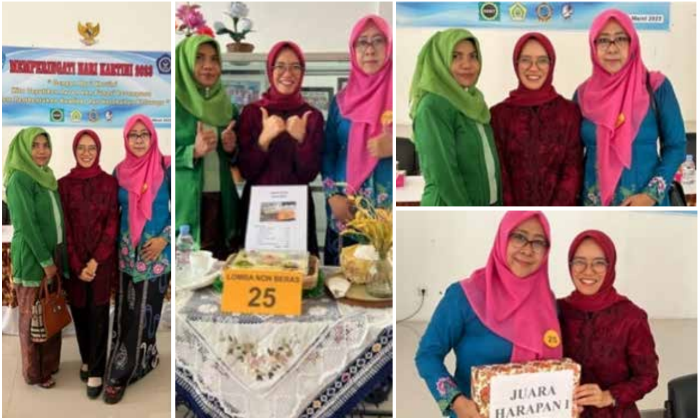
Mengikuti acara GOW dalam rangka peringatan Hari Kartini. Acara diisi dengan Lomba Membuat Takjil Non Beras. IIDI Cabang Brebes mendapat Juara Harapan 1.