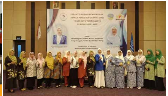
Tanggal 14 Juni 2023, menghadiri pelantikan Dewan Pengurus Cabang IWAPI Kota Tasikmalaya. (Foto kanan atas)