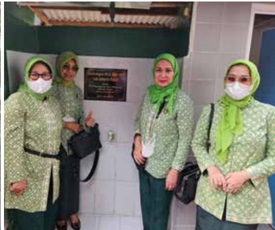
Menyerahkan bahan-bahan bangunan berupa pasir, semen, batu bata, keramik, wc jongkok, pintu dan lain-lain yang akan digunakan untuk merenovasi 4 buah MCK yang biasa digunakan oleh masyarakat yang bertempat tinggal disekitar Rt 016, Kelurahan Pegangsaan Kecamatan Menteng, Jakarta Pusat. (Foto kiri)