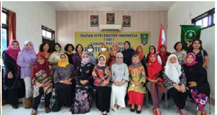
Giat IIDI Cabang Kota Kediri tanggal 20 Maret 2023 yaitu pertemuan rutin sekaligus rapat persiapan BBID dan baksos Ramadhan.