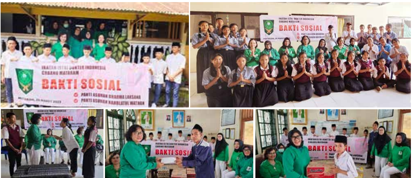
Pada tanggal 29 Maret 2023, IIDI Cabang Mataram telah melaksanakan Bakti Sosial ke Panti Asuhan Hindu Dharma Laksana dan Panti Asuhan Muslim Nadhlatul Wathan.