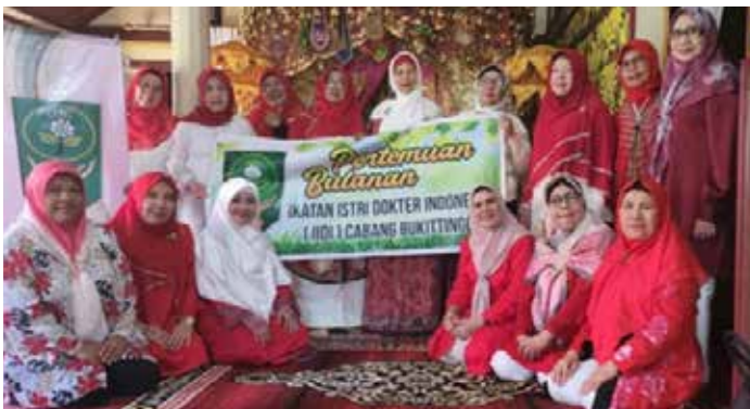
Pertemuan bulanan (kiri)