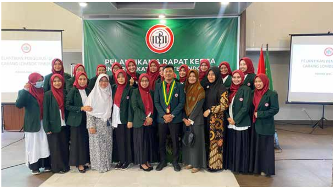
Kegiatan IIDI Cabang Lombok Timur, pada sabtu, 21 Oktober 2023, kami menghadiri undangan Pelantikan Kepengurusan IIDI Cabang Lombok Timur Masa Bakti 2023 - 2026