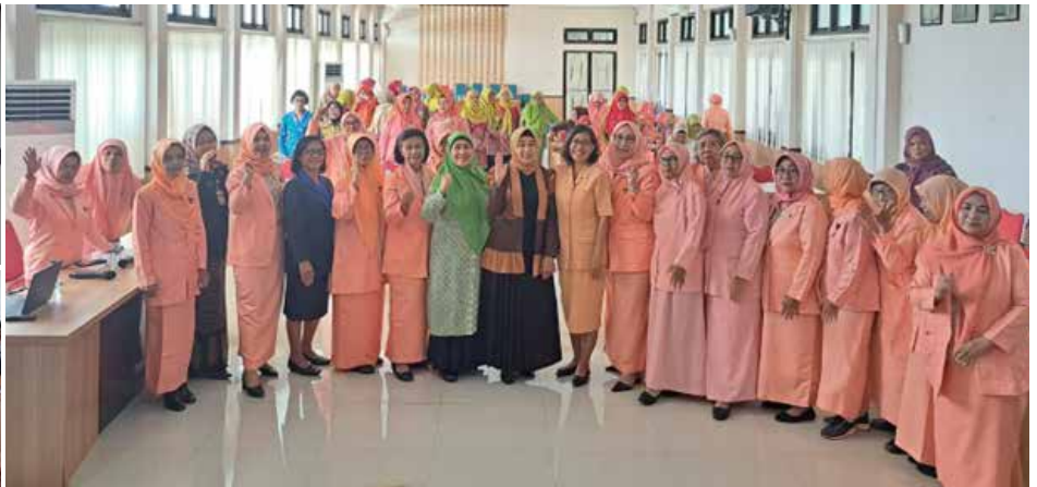
Rapat bersama Gabungan Organisasi Wanita (GOW) 2023