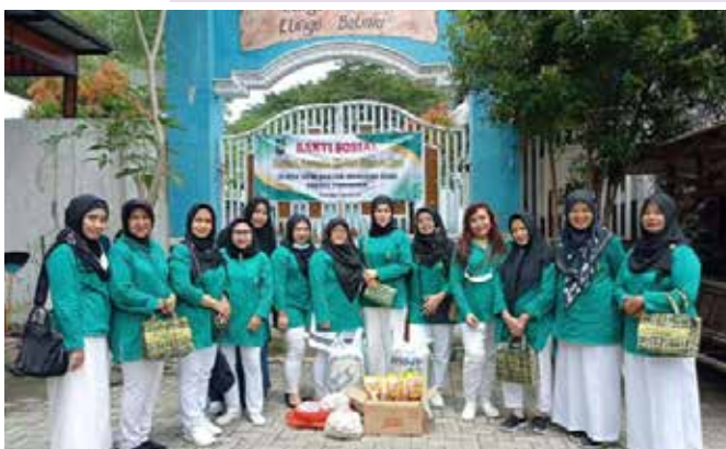
Bakti sosial dalam rangka Ramadhan