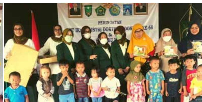
Cukupi kebutuhan buah dan sayur pada Balita