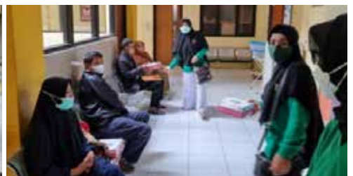
IIDI Cabang Kota Tegal ikut berpartisipasi dalam mendukung Pemerintah memberantas TBC berupa Pembinaan Kesehatan bagi Penderita Tuberculosis Paru serta pemberian Nasi Box bagi pasien dan keluarga di Balai Pengobatan Paru Kota Tegal.