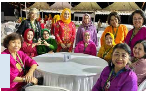
Welcome Dinner IDI & IIDI bersama Walikota Kendari