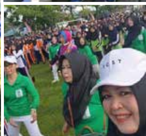
Kegiatan pagi ini, Sabtu tanggal 11 Februari 2023 IIDI senam bersama dalam rangka HUT Purworejo