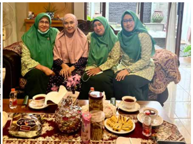
Mengunjungi teman sejawat IIDI yang terdampak banjir di Kabupaten Sukoharjo (Foto kanan atas)