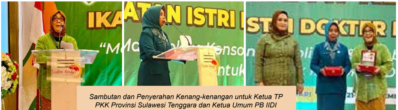
Sambutan dan Penyerahan Kenang-kenangan untuk Ketua TP PKK Provinsi Sulawesi Tenggara dan Ketua Umum PB IIDI