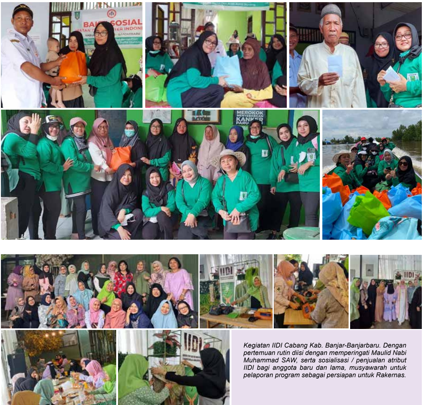
Kegiatan IIDI Cabang Kab. Banjar-Banjarbaru. Dengan pertemuan rutin diisi dengan memperingati Maulid Nabi Muhammad SAW, serta sosialisasi / penjualan atribut IIDI bagi anggota baru dan lama, musyawarah untuk pelaporan program sebagai persiapan untuk Rakernas.