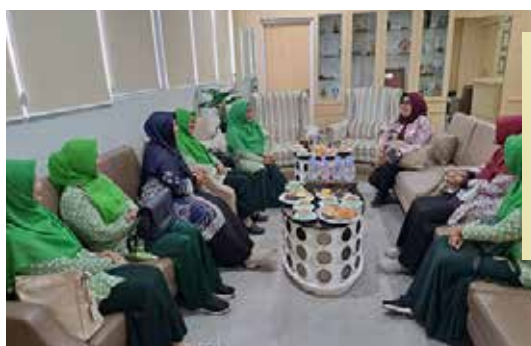
Audiensi dengan Dirut RSUD Ciawi terkait acara HUT IIDI ke-69. (2 foto kiri)