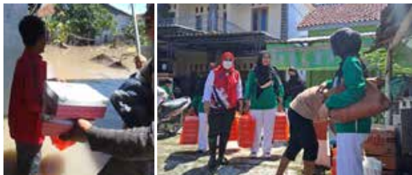
IIDI Cabang Kota Tegal memberikan bantuan bingkisan kepada 100 orang yang tertimpa bencana banjir.