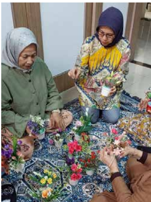
Merangkai bunga untuk diniagakan bersama seksi usaha dan dana