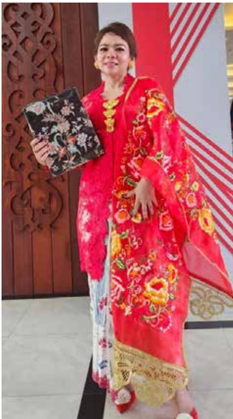
Perwakilan IIDI Cabang Pontianak mendapat Best costum dalam acara Gelar Karya DWP SeKalbar dalam rangka HUT RI ke 78. (Foto sebelah kiri)