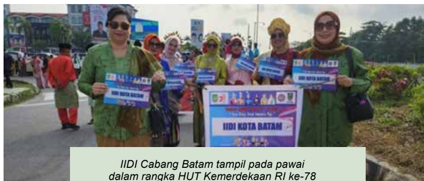
IIDI Cabang Batam tampil pada pawai dalam rangka HUT Kemerdekaan RI ke-78