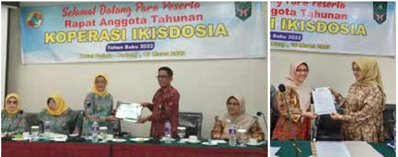
RAT IKISDOSIA, Silaturahmi IIDI dan Serah Terima Sekretaris IIDI Cabang Padang