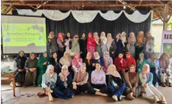
Pertemuan rutin bulan Januari 2023 bertempat di RM Saung Gunung Jati, dihadiri oleh 35 orang anggota diisi dengan Pelatihan Fotografi "Materi Dasar-dasar fotografi". (Foto kiri atas)