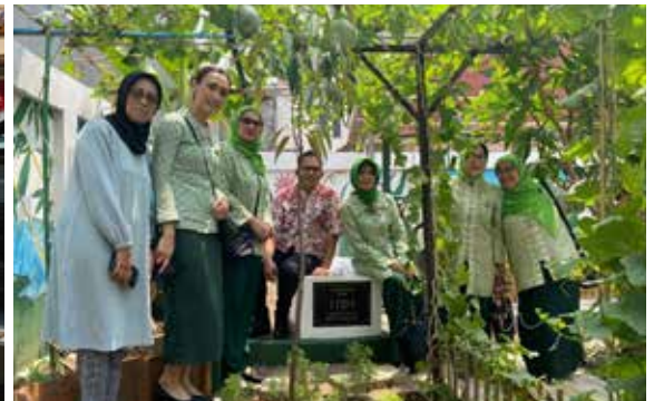
Penyerahan sumbangan IIDI Cabang Jakarta Pusat berupa sumur dan tempat cuci tangan bagi warga RW 07 Kelurahan Pegangsaan. Sumbangan ini bertepatan dengan PHBS. (Foto kanan atas)