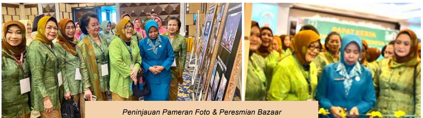
Peninjauan Pameran Foto & Peresmian Bazaar