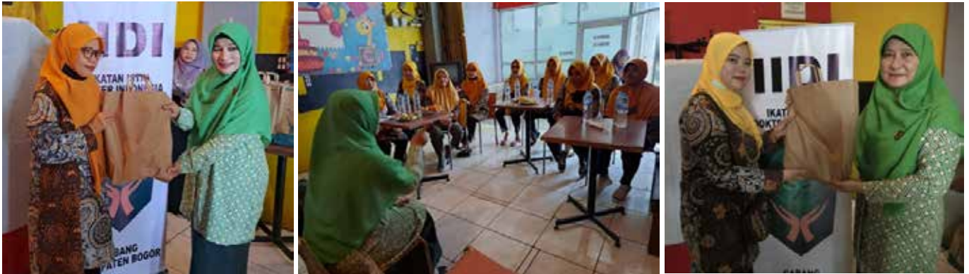
Rapat koordinasi dengan kader-kader posyandu binaan IIDI Cabang Kabupaten Bogor ROS 1 dan ROS 8 Leuwiliang sekaligus memberikan bingkisan menjelang bulan Ramadhan 1444 H.

IIDI dan IDI Cabang Kabupaten Bogor pada tanggal 5 Mei 2023 melaksanakan kegiatan bakti sosial kepada korban banjir bandang di Leuwisadeng Kabupaten Bogor yang diikuti oleh kurang lebih 120 orang, dengan agenda sebagai berikut :