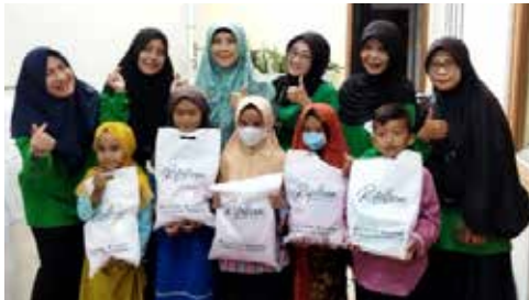
Kegiatan bakti sosial IIDI Cabang Wonosobo dengan melaksanakan Pesantren Kilat. (2 foto atas)