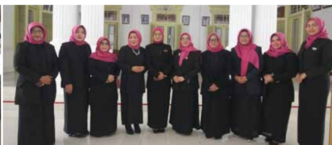
Kegiatan Pelantikan Ketua GOW Kabupaten Cirebon. Terpilih tiga orang dari IIDI Cabang Kabupaten Cirebon yaitu menjadi Ketua GOW, Sekretaris GOW dan Bendahara GOW. Pada acara Pelantikan Ketua GOW Kabupaten Cirebon berfoto bersama Ibu dan Bapak Bupati Kabupaten Cirebon