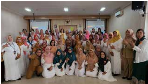
Syawalalan halal bi halal GOW Boyolali. IIDI hadir dengan 2 perwakilan. (kiri)