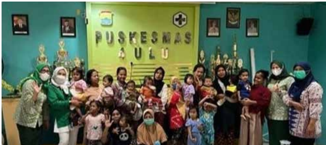
Kegiatan Rutin IIDI Cabang Palembang bersama Puskesmas 4 Ulu yaitu setiap Jumat memberikan bantuan makanan bergizi untuk anak-anak stunting. (3 foto atas dan samping kiri)