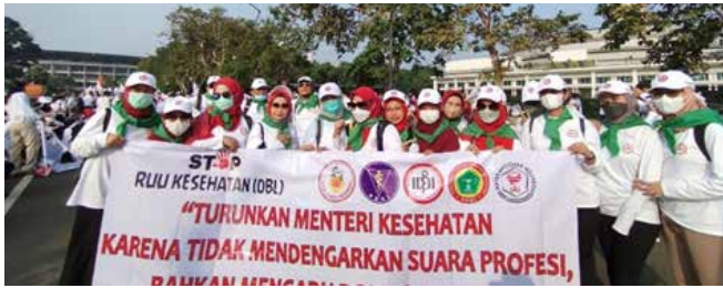
Mengikuti & membantu IIDI pada demo Aksi Damai di Gedung DPR MPR sebagai Seksi Konsumsi dan Perlengkapan.

Mengadakan road show ketahanan keluarga dengan tema "IIDI Cabang Kabupaten Bogor terus bergerak menanamkan budi pekerti, mencegah bahaya Narkoba / HIV AIDS serta stunting & sosialisasi kekerasan pada anak dan remaja" dalam rangka memperingati Hari Anak Nasional 2023.