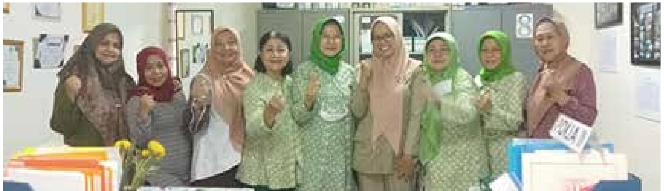
Menghadiri Peringatan Hari Ibu di GBK bersama Ibu Ketua Umum dan PB IIDI.