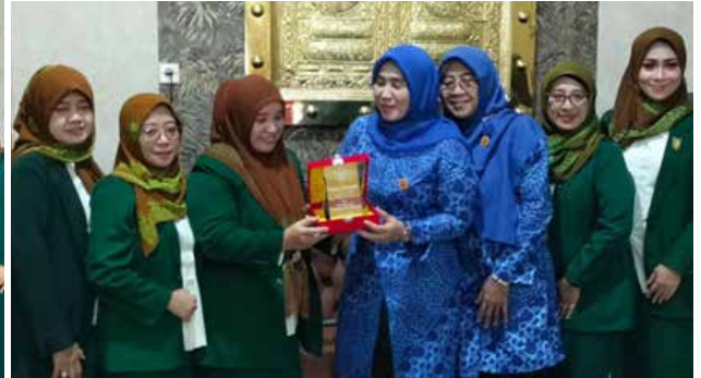
Dalam rangka HUT IIDI ke-69 dengan Tema "IIDI Terus Giat Membangun Kolaborasi", IIDI Cabang Jombang melaksanakan kunjungan ke-3 tujuan yaitu Dinas PPKB PPPA, GOW dan IDI