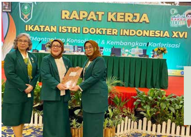
Penyerahan Hasil Keputusan RAKER IIDI XVI Tahun 2023 dari Ketua dan Sekretaris Sidang kepada Ketua Umum PB IIDI