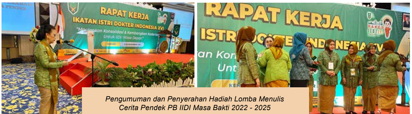
Pengumuman dan Penyerahan Hadiah Lomba Menulis Cerita Pendek PB IIDI Masa Bakti 2022 - 2025