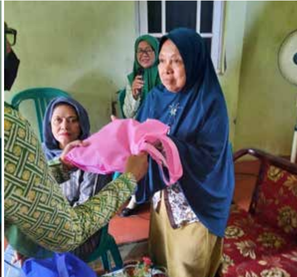
Pemberian kenang-kenangan bagi Pengasuh Panti Asuhan. (Foto sebelah)