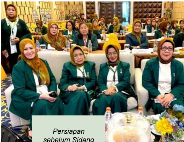
Persiapan sebelum Sidang Pleno III