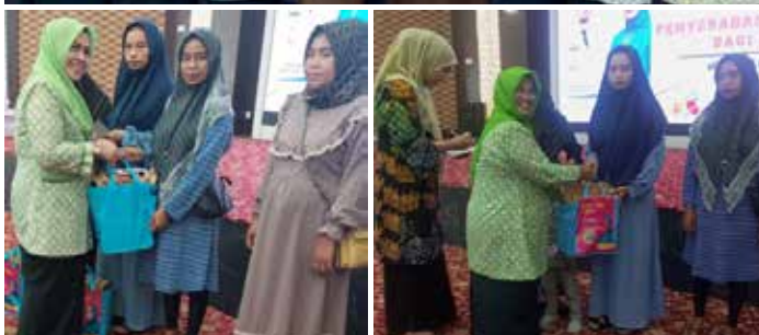
Kegiatan IIDI cabang Bukittinggi hari ini bersama Pemda Bukittinggi. (Tiga foto atas)