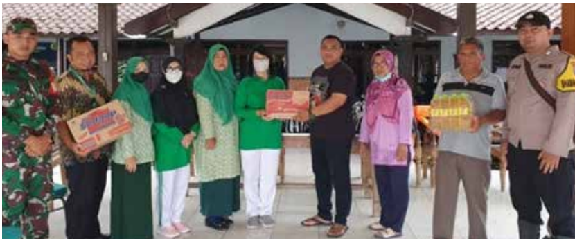
Penyerahan bantuan korban banjir di Desa Laban Kabupaten Sukoharjo (Foto kiri atas)