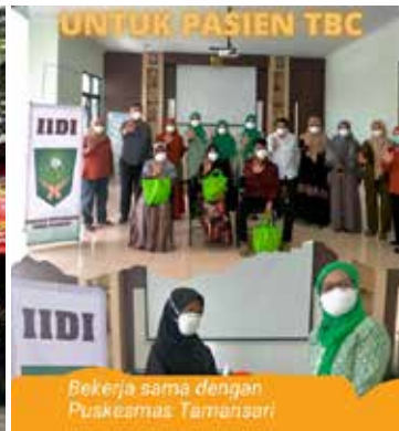
Memberikan bantuan makanan bergizi untuk Penderita TBC Puskesmas Tamansari Kota Tasikmalaya. (Foto tengah atas)