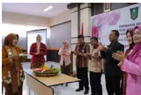
Peringatan HUT IIDI Ke-69

Mengunjungi pengrajin Batik Kutawaru yang merupakan warisan budaya leluhur di Cilacap di mana batik telah diakui keindahannya dan nilai seni budayanya di seluruh dunia.