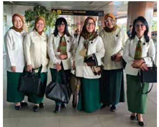
Ketua Umum & Sekretaris Jenderal dibatasi Garis Lintang Bumi Utara dan Selatan