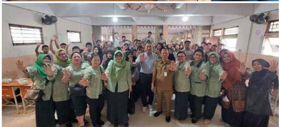
IIDI Cabang Pontianak bekerjasama dengan Puskesmas Pal 3 Cegah Stunting dengan penyuluhan tentang Kesehatan Reproduksi Remaja di SMA BINA UTAMA PONTIANAK. (2 Foto sebelah kanan)