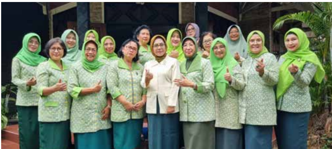
IIDI Cabang Kota Semarang mengunjungi dan bersilaturahmi dengan IIDI Cabang Kabupaten Semarang tanggal 9 Oktober 2023.