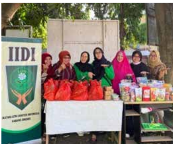
Pada bulan Ramadhan 1444 H, IIDI Cabang Brebes mengadakan kegiatan Bazar Murah Ramadhan di Gedung GOW serta mengunjungi dan sedikit berbagi dengan anak-anak di Panti Asuhan.