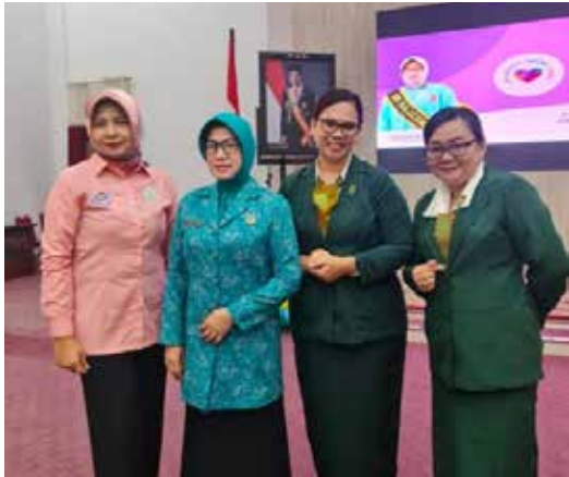
IIDI Cabang Pontianak menghadiri acara Peringatan Hari Thalasemia Sedunia di Balai Petitih. Perwakilan IIDI bersama Ibu Gubernur dan Ibu Sekda Prov. Kalimantan Barat. (Foto sebelah kiri)