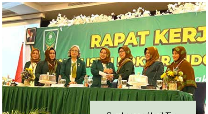
Pembacaan Hasil Tim Perumus dan Tanggapan