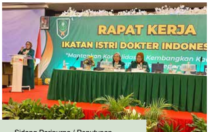
Sidang Paripurna / Penutupan