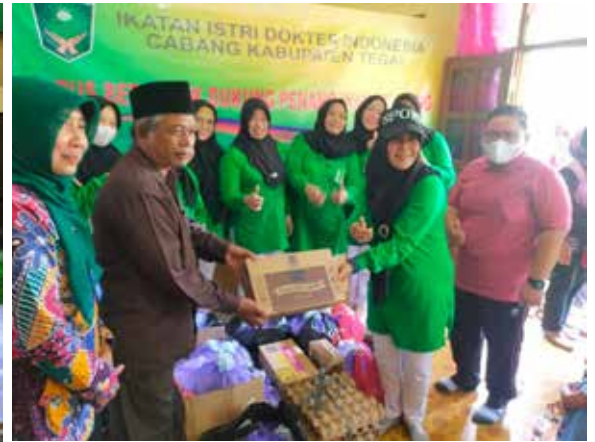
Bapak Kepala Desa menerima bantuan susu dan telur ayam untuk Cafeta Desa Kalisapu yang memiliki stunting angka tertinggi. (Foto kanan atas)