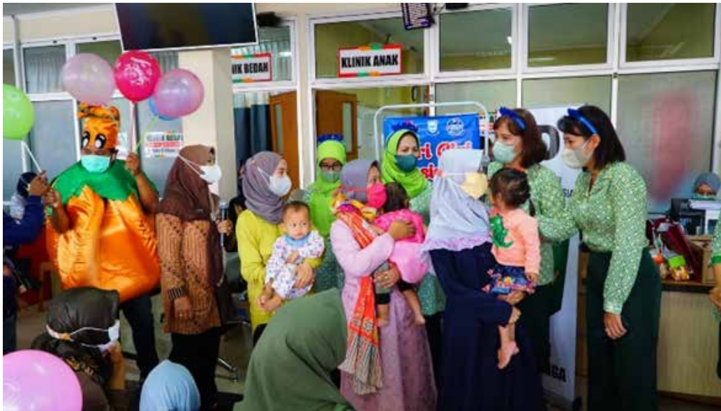
IIDI Cabang Purbalingga bersama tim RSUD Goeteng mengadakan pembagian susu UHT plain sebanyak 75 buah dan makanan sehat.