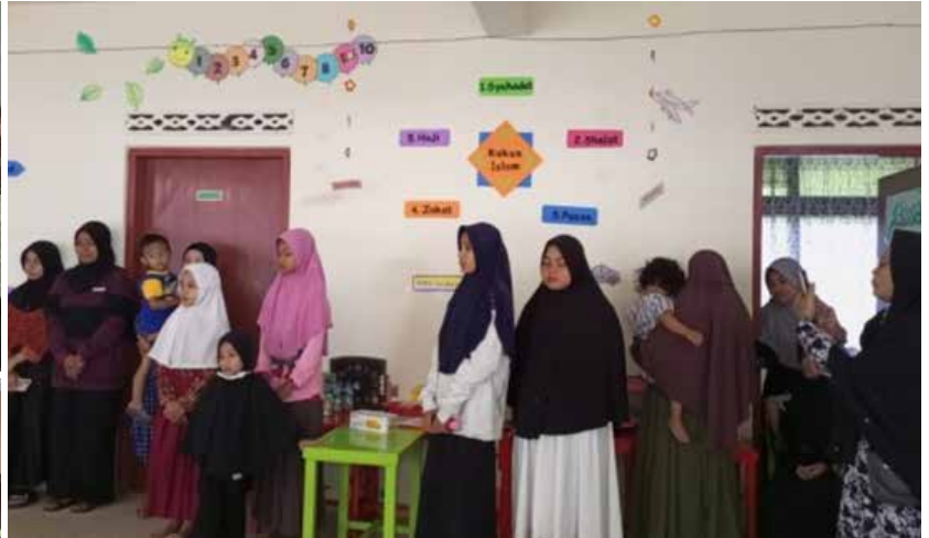
Berbagi Takjil, Zakat dan Infak di bulan Ramadhan 1444 H Kegiatan Ramadhan 1444 H di IIDI Cabang Bukittinggi.