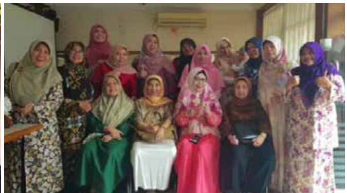
Kegiatan Seksi Pendidikan yaitu Kelompok Belajar Tahsin yg diadakan 1 x 2 minggu. (kanan)