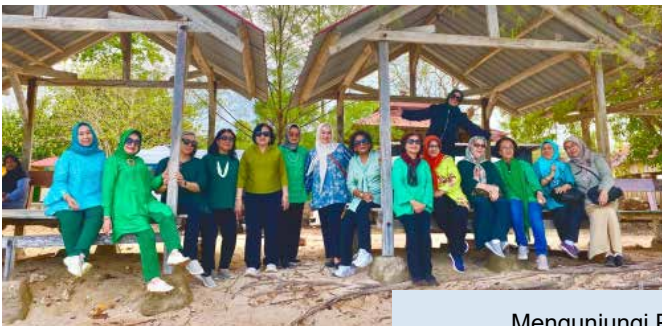
Mengunjungi Pantai Toronipa