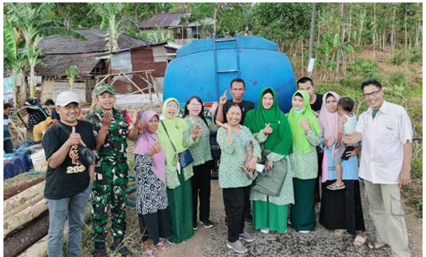
Bakti sosial menyumbangkan air bersih bagi desa Pulosari dan desa Cikendung yang mengalami kekeringan