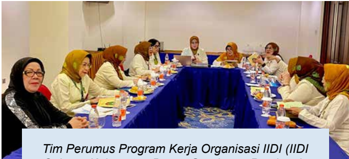
Tim Perumus Program Kerja Organisasi IIDI (IIDI Cabang Kabupaten Bogor, Surabaya, Pontianak, Kota Kendari dan Kota Semarang)