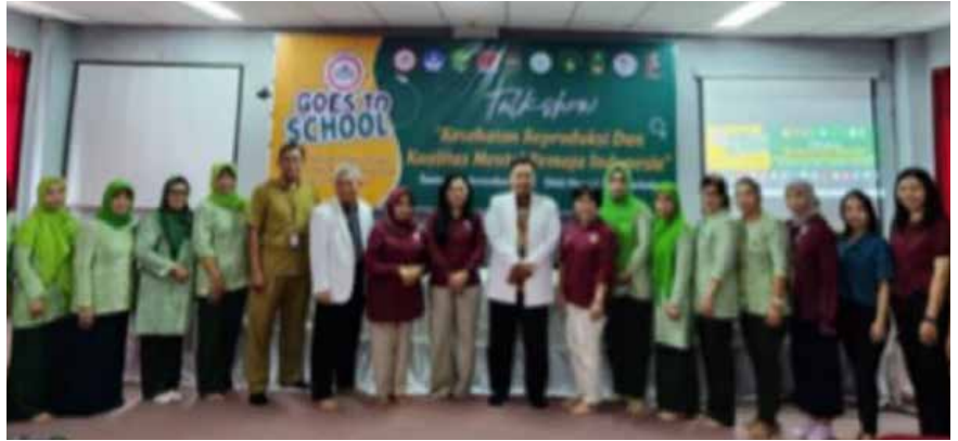
Menghadiri acara HUT IDI Ke 73