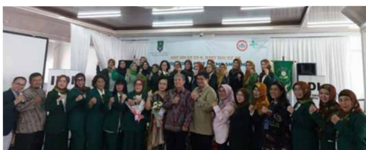
Mengadakan Puncak HUT IIDI ke 69 dan Hari Ibu ke-95 di Aula RSUD Ciawi Kabupaten Bogor.