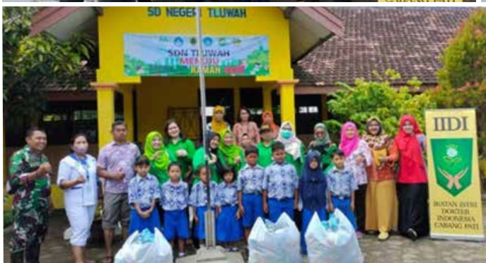
Bantuan yang berdampak banjir. Karena lokasi debit air masih tinggi jadi hanya kami serahkan ke posko dan kita juga menyerahkan ke desa Tluwah harus naik Jukung.