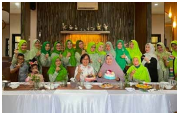
Silaturahmi dengan IIDI Cabang Kabupaten Bangka