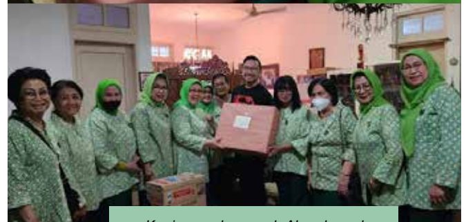
Kunjungan ke rumah Almarhumah Ny. Meike B. Sutedjo