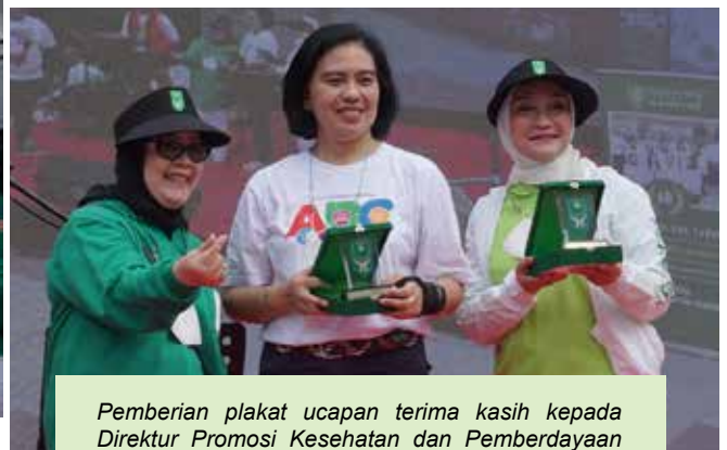
Pemberian plakat ucapan terima kasih kepada Direktur Promosi Kesehatan dan Pemberdayaan Masyarakat Kementerian Kesehatan RI dan wakil dari PERWATUSI