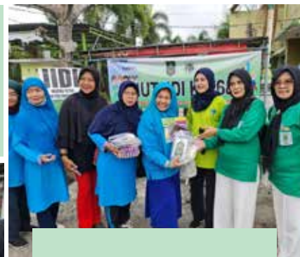
Puncak acara HUT IIDI ke-68, hari Minggu tanggal 11 Desember 2022 di halaman Gedung Wanita dengan acara senam bersama PERWATUSI, pembagian paket sayur mayur, pembagian goody bag, pembagian flyer tentang stunting dan garage sale.