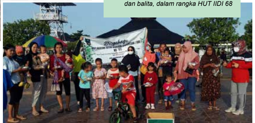
Pembagian makanan bergizi untuk bumil dan balita, dalam rangka HUT IIDI 68