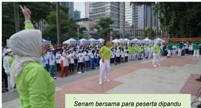
Senam bersama para peserta dipandu instruktur senam dari PERWATUSI