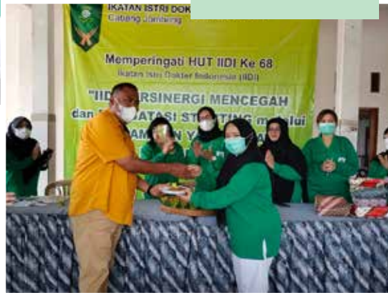
Pemotongan Tumpeng HUT IIDI ke-68