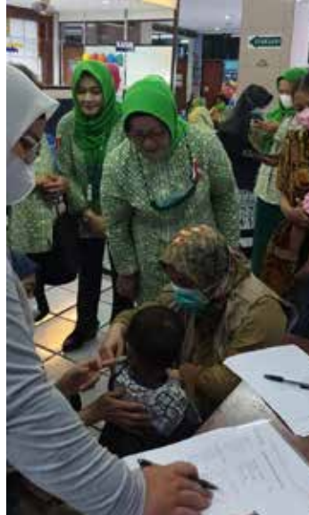
Menghadiri undangan IIDI Cabang Jakarta Selatan, Pelaksanaan Pemeriksaan Kesehatan Massal Bagi Anak-anak Terduga Stunting di RSUP Fatmawati tanggal 16 Oktober 2022