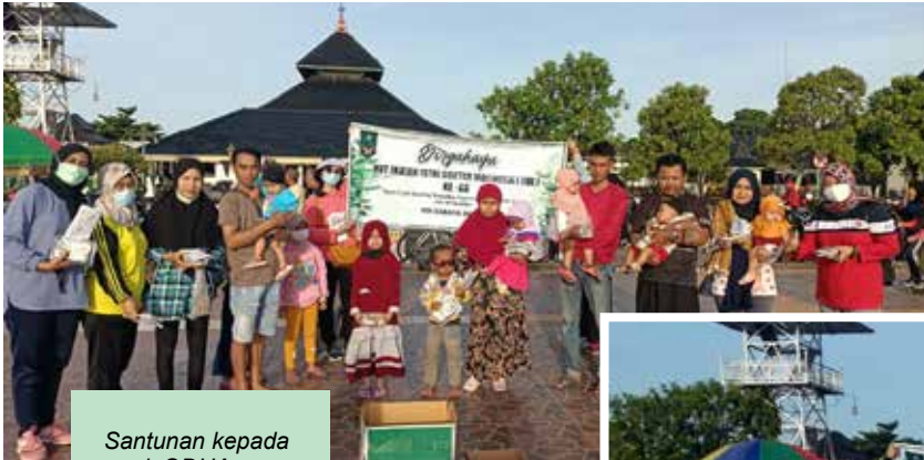
Santunan kepada anak ODHA