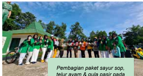
Pembagian paket sayur sop, telur ayam & gula pasir pada peserta senam

Kegiatan ini dilaksanakan bekerjasama dengan IDI Cabang Lampung Tengah, Pemerintah Kampung Poncowati, Pasar Kreativitas Masyarakat Poncowati (PAK MONTI), Puskesmas Poncowati dan Klinik Utama Rahayu.