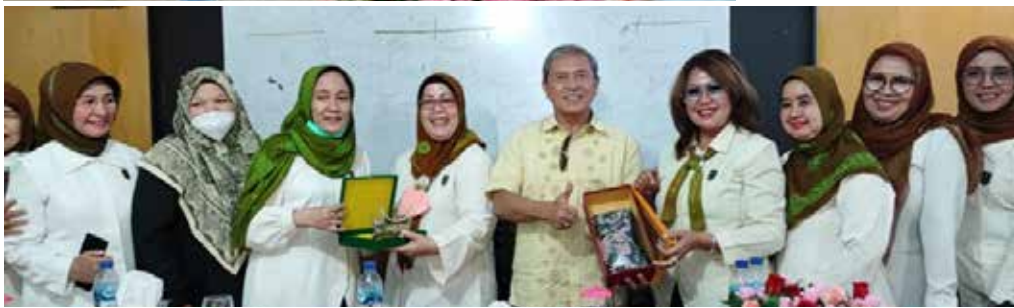
Pertemuan Kemitraan IIDI dengan Kepala Perwakilan BKKBN Provinsi Sumatera Barat pada tanggal 6 Oktober 2022. Ketua Umum Pengurus Besar IIDI bersama IIDI Cabang Padang.