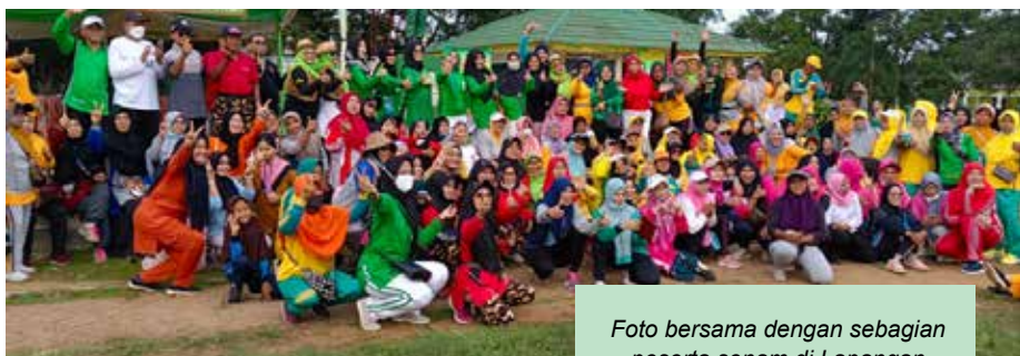
Foto bersama dengan sebagian peserta senam di Lapangan Monumen Poncowati