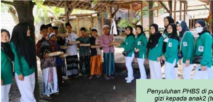
Penyuluhan PHBS di panti asuhan dan pemberian gizi kepada anak2 (telor, makanan dan susu)