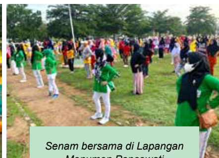
Senam bersama di Lapangan Monumen Poncowati Lampung Tengah