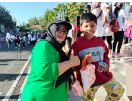
Pembagian makanan sehat untuk Bumil, anak dan bayi