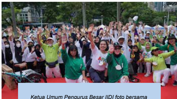
Ketua Umum Pengurus Besar IIDI foto bersama dengan Direktur Jenderal Promosi Kesehatan dan Pemberdayaan Masyarakat Kementerian Kesehatan RI, Ketua Panitia HUT IIDI ke 68 serta sebagian peserta yang hadir