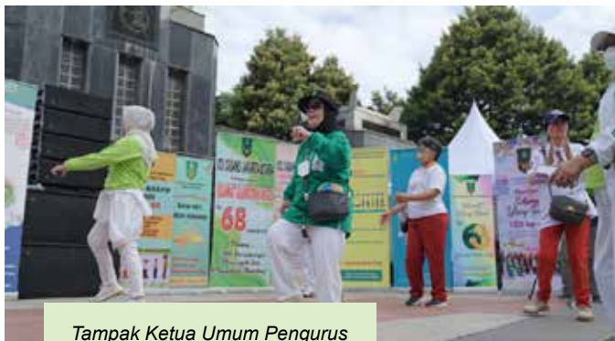
Tampak Ketua Umum Pengurus Besar IIDI turut senam bersama