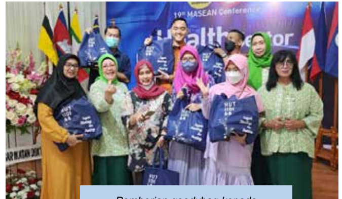
Pemberian goodybag kepada karyawan Pengurus Besar IDI