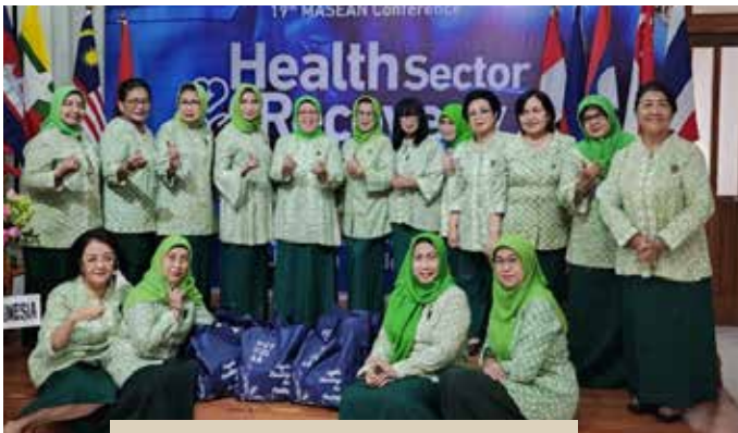
Foto bersama sebelum pemberian goodybag