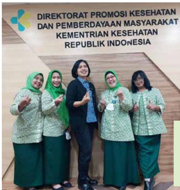
Audiensi Pengurus Besar IIDI dengan Direktur Promosi Kesehatan dan Pemberdayaan Masyarakat Kementerian Kesehatan RI (21 Oktober 2022)