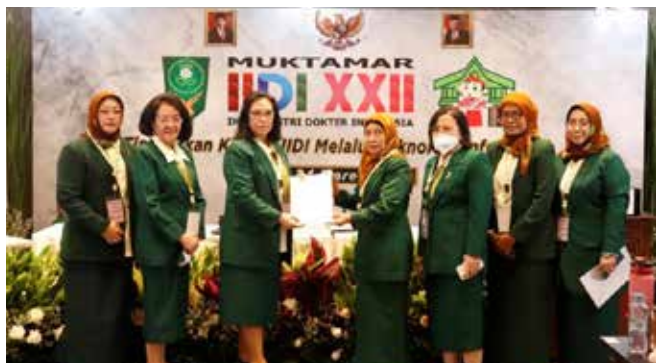
Penyerahan Berita Acara Hasil Pemilihan Ketua Umum Pengurus Besar IIDI Masa Bakti 2022 - 2025 dari Ketua PPKU kepada Ketua Sidang Pleno III