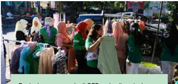
Penjualan garage sale di CFD yg hasil penjualannya akan disumbangkan untuk anak2 stunting