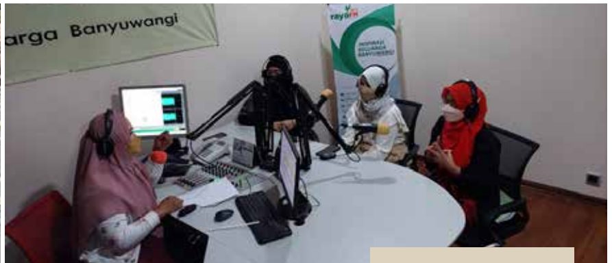
Talk Show bekerja sama dg Radio Raya FM dg Tema "Tips dan Trik Tampil Menawan saat Hamil"