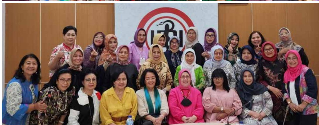
Rapat Pengurus Besar IIDI bersama dengan IIDI Cabang se-Jabotabek dalam rangka Persiapan acara HUT IIDI ke-68 Tahun 2022 (27 Oktober 2022)