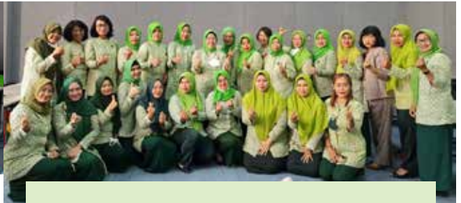
Tanggal 26 September 2022, bersama dengan IIDI Cabang Kabupaten Kediri, Kota Kediri, Kabupaten Blitar, Kota Blitar, Tulungagung, Trenggalek, Nganjuk