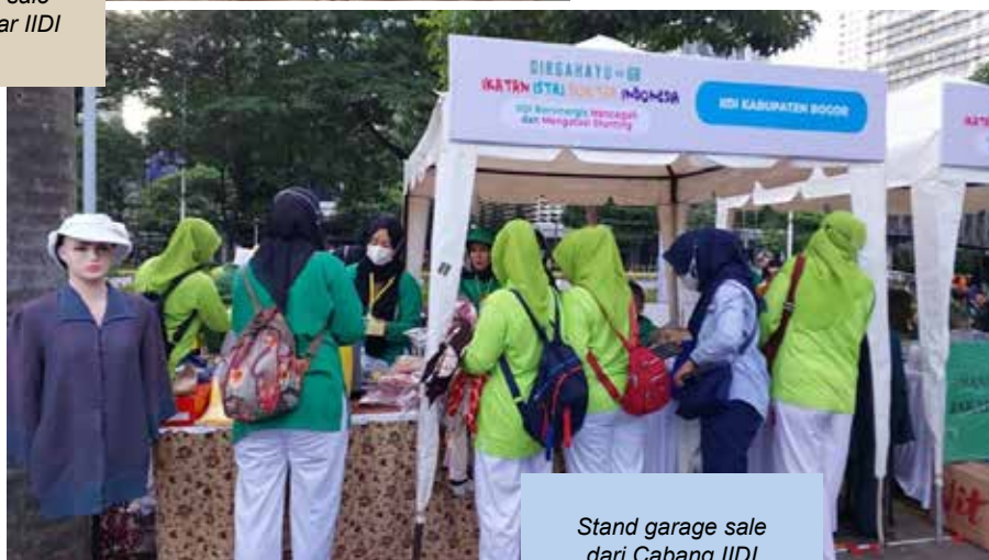
Stand garage sale dari Cabang IIDI