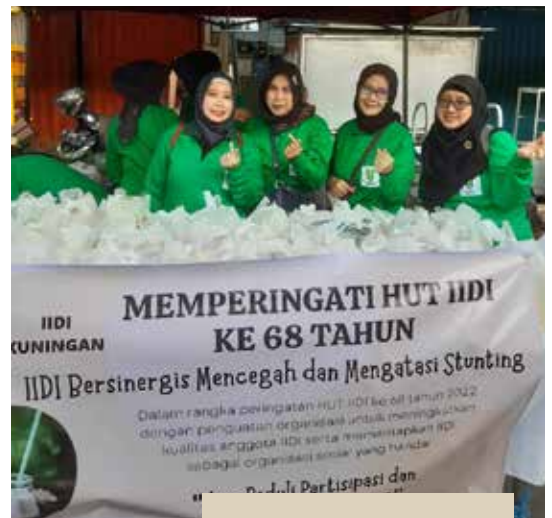
Anggota IIDI Kuningan di stand garage sale di CFD