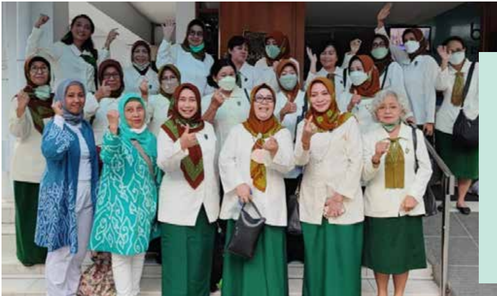
Pertemuan Kemitraan IIDI dengan Kepala Perwakilan BKKBN Daerah Istimewa Yogyakarta pada tanggal 17 November 2022, Pengurus Besar IIDI bersama IIDI Cabang Yogyakarta.