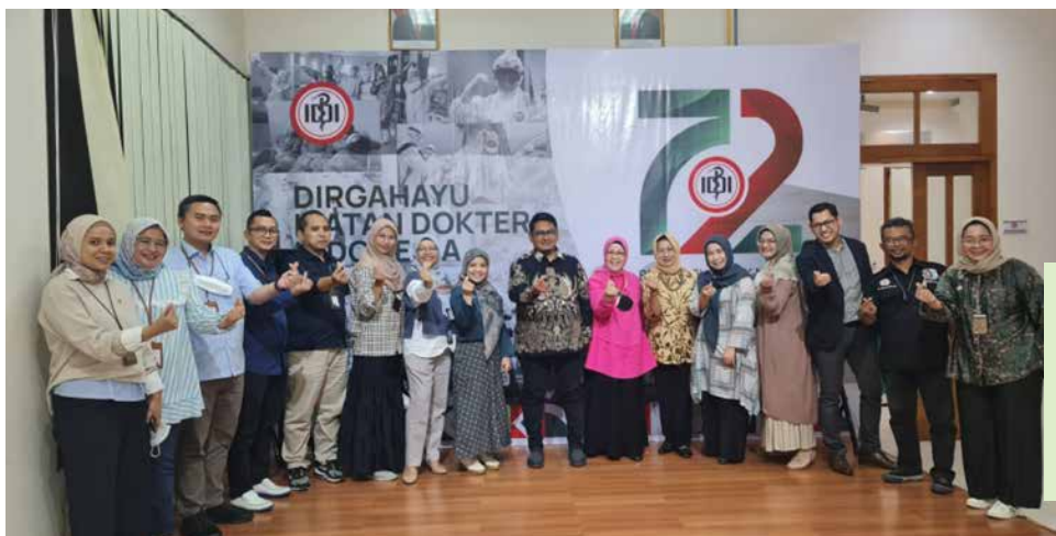
Temu Calon Mitra Bank Syariah Indonesia (BSI) bersama Pengurus Besar IIDI pada tanggal 27 Oktober 2022 di Gedung IIDI - Jakarta