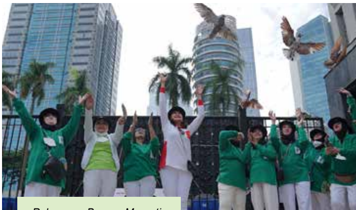
Pelepasan Burung Merpati