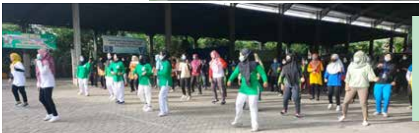
Olahraga sehat bersama masyarakat di kelurahan Sukomulyo Lamongan