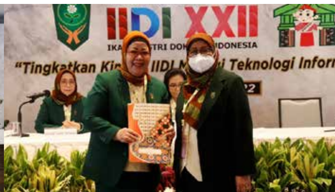
Penyerahan dan Pengesahan Hasil Rumusan Pra Muktamar IIDI menjadi Hasil Keputusan Muktamar IIDI XXII dari Tim Perumus kepada Ketua Umum Pengurus Besar IIDI Masa Bakti 2022 - 2025