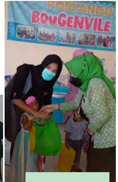
Pembagian sayuran kepada Ibu balita serta makanan minuman sehat untuk balita di Posyandu Binaan IIDI di kelurahan Sukomulyo Lamongan