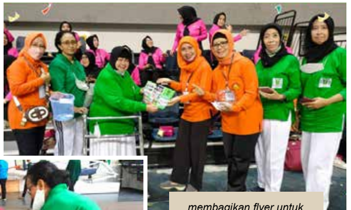
membagikan flyer untuk mencegah stunting