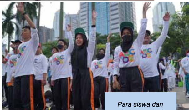
Para siswa dan siswi mengikuti senam bersama