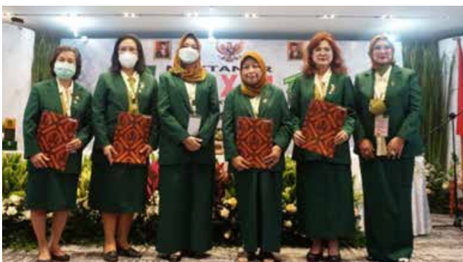
Pemberian Penghargaan kepada Anggota Pengurus Besar IIDI yang telah Mengabdikan selama 15 Tahun Berturut-turut