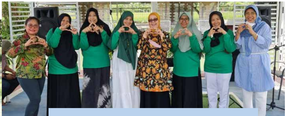
Kunjungan Konsultasi Organisasi dengan Ibu-ibu IIDI Cabang Palu pada tanggal 24 November 2023