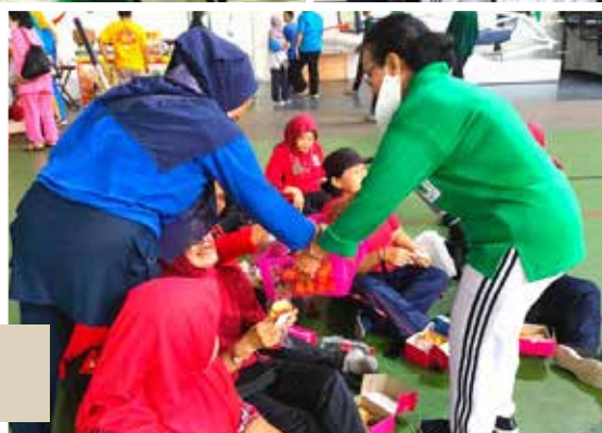
Jeruk madu untuk peserta senam