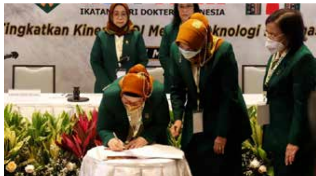
Penandatanganan Berita Acara dan Serah Terima Jabatan Ketua Umum Pengurus Besar IIDI Masa Bakti 2018 - 2021 kepada Ketua Umum Pengurus Besar IIDI Masa Bakti 2022 - 2025