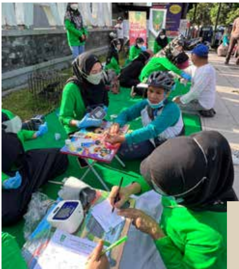
Bersama IDI melaksanakan pemeriksaan kesehatan ukur BB, Periksa Tekanan darah dan Kadar Gula Acak dan khitanan massal