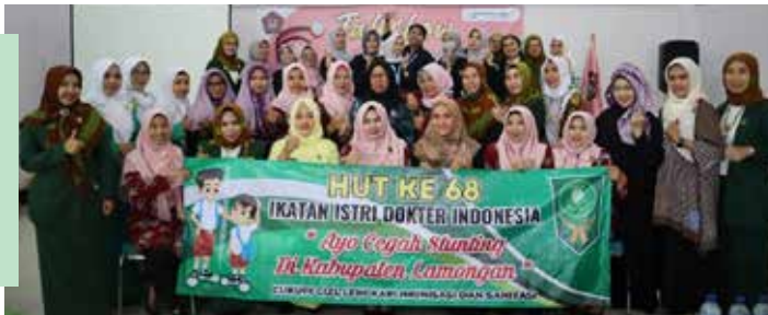
Sosialisasi cegah stunting di pertemuan GOW dalam rangka HUT IIDI dan HUT GOW Kabupaten Lamongan