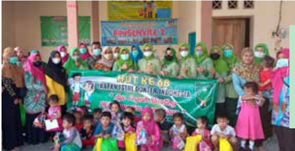
Penyuluhan tentang stunting dan pencegahannya di Posyandu binaan IIDI di Kelurahan Sukomulyo Lamongan