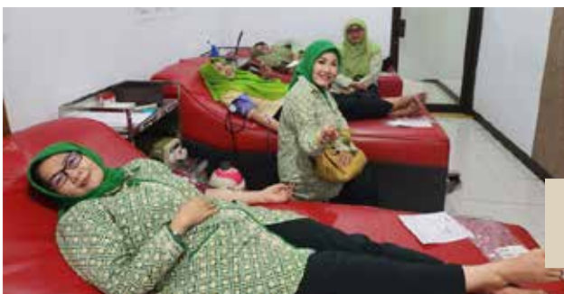
Kegiatan donor darah di PMI Kab Kuningan