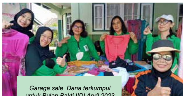
Garage sale. Dana terkumpul untuk Bulan Bakti IIDI April 2023