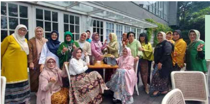
Sebagian undangan yang hadir berfoto bersama Ketua Umum PERWATUSI