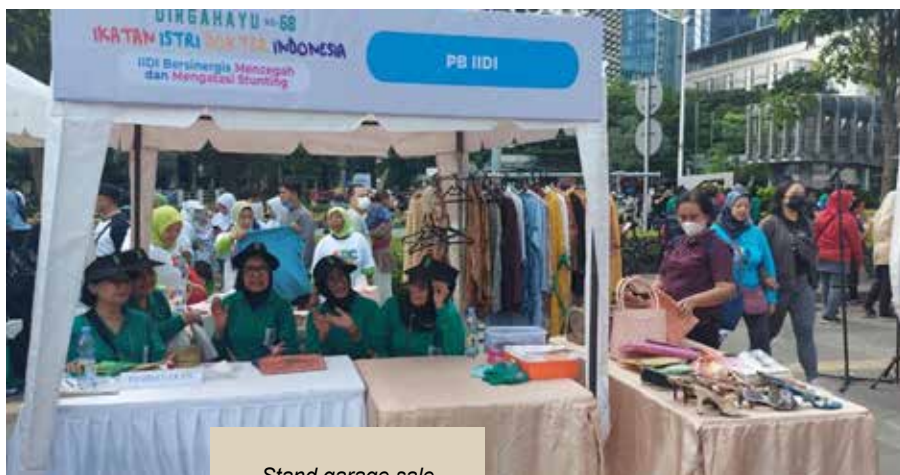
Stand garage sale Pengurus Besar IIDI