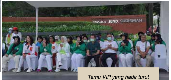
Tamu VIP yang hadir turut berdoa bersama