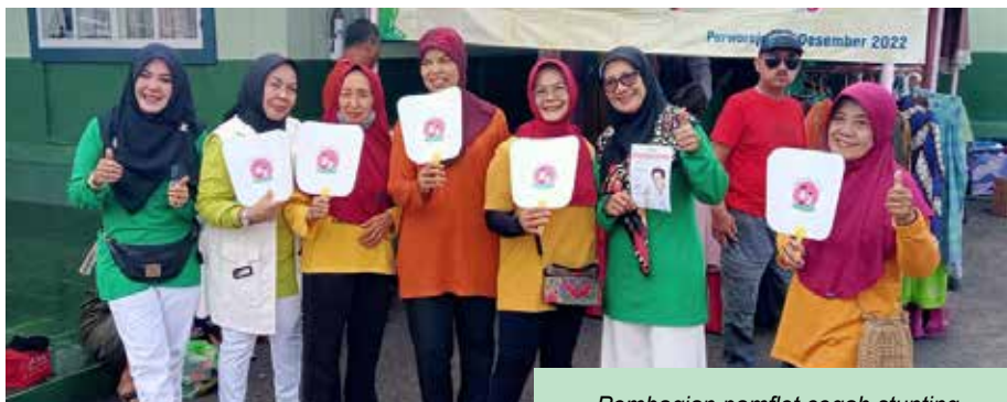
Pembagian pamflet cegah stunting

Puncak HUT IIDI ke 68 diadakan IIDI Cabang Purworejo bersinergis dengan KODIM dilaksanakan di halaman Kodim 0708 Purworejo dengan mengadakan kegiatan Senam bersama, edukasi tentang stunting, pembagian pamflet kipas Cegah Stunting Itu Penting, menyediakan contoh makanan sehat untuk pengunjung CFD Purworejo, garage sale pakaian pantas pakai dari anggota IIDI.