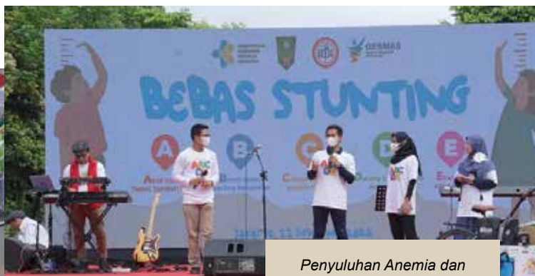
Penyuluhan Anemia dan Tablet Tambah Darah