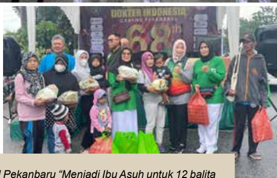
Foto bersama tamu undangan, ketua IDI Pekanbaru, Kepala Dinas Kesehatan Kota Pekanbaru, anggota DPRD Kota Pekanbaru, Ketua-ketua organisasi wanita yang ada di Pekanbaru.

Program unggulan IIDI Pekanbaru "Menjadi Ibu Asuh untuk 12 balita stunting dan 1 ibu hamil stunting" memberikan bantuan makanan sehat (susu Pediasure, beras, minyak, telur dan abon sapi)