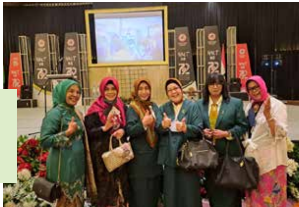
Menghadiri HUT IDI ke 72 Tahun 2022. Hotel Grand Mercure Bandung, 24 Oktober 2022