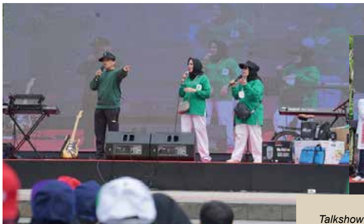
Talkshow mengenai Stunting