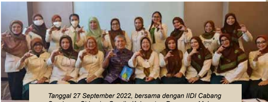
Tanggal 27 September 2022, bersama dengan IIDI Cabang Surabaya, Sidoarjo, Gresik, Kabupaten Pasuruan, Malang, Lamongan, Mojokerto, Jombang, Bangkalan.