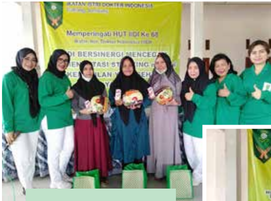
Penyerahan sayur mayur dan susu untuk ibu hamil