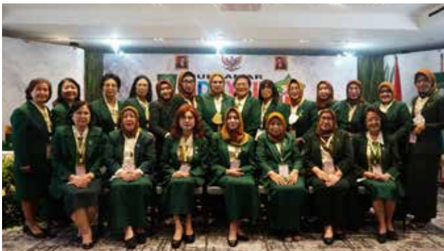
Foto bersama sebelum acara Muktamar IIDI XXII Tahun 2022 dimulai