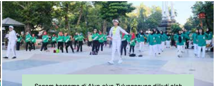
Senam bersama di Alun-alun Tulungagung diikuti oleh anggota IIDI Cabang Tulungagung & masyarakat umum