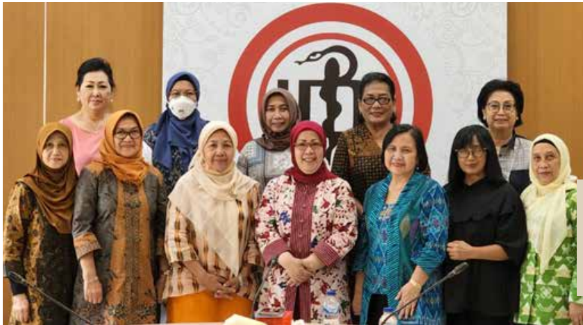
Pertemuan PB IIDI dengan IIDI Cabang Jakarta Timur dan Jakarta Utara tanggal 22 Juni 2022