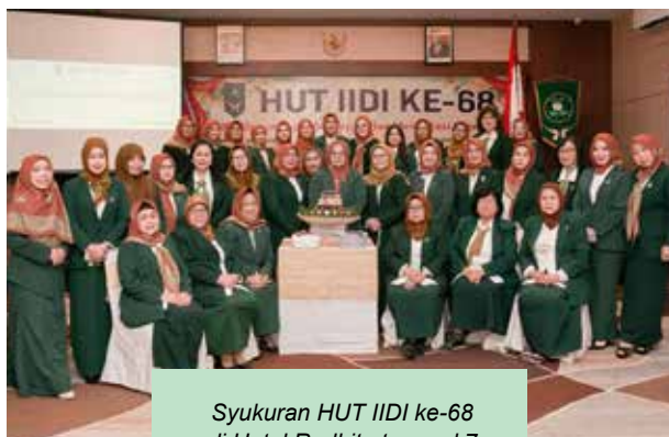
Syukuran HUT IIDI ke-68 di Hotel Rodhita tanggal 7 Desember 2022

IIDI Cabang Banjarmasin mengadakan Puncak HUT IIDI ke-68 bersinergis dengan PERWATUSI. Kegiatan diadakan di halaman Gedung Wanita dengan mengadakan kegiatan senam osteoporosis bersama, edukasi tentang stunting, pembagian paket sayur mayur dan tempe, pembagian goodybag untuk anak-anak berisi makanan dan minuman bergizi, pembagian flyer tentang stunting dan garage sale.