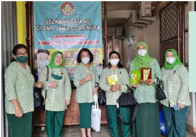
Menghadiri undangan IIDI Cabang Kabupaten Bogor. Pembukaan Kegiatan Road Show 2022 dengan Tema "Remaja Sadar Kesehatan Reproduksi dapat Mencegah Stunting - Remaja Waspada LGBT dan NARKOBA Hindari Masalah Genting" pada tanggal 5 Oktober 2022 di SMP - SMA Citra Nusa Bogor