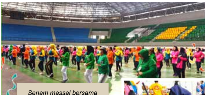
Senam massal bersama organisasi wanita DIY