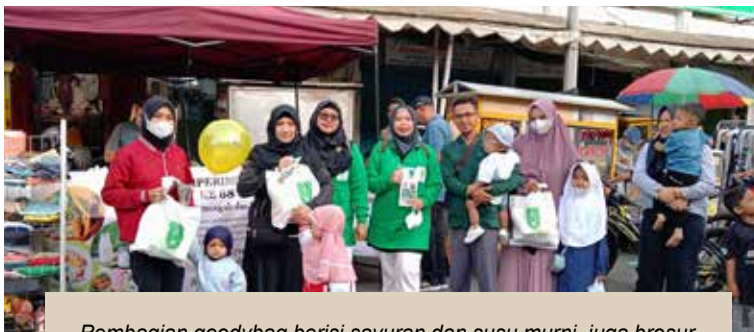
Pembagian goodybag berisi sayuran dan susu murni, juga brosur tentang stunting ke pengunjung CFD yang memiliki balita