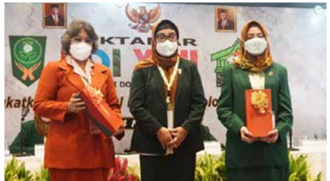
Pemberian kenang-kenangan dari Ketua Panitia Pelaksana Muktamar IIDI XXII kepada wakil dari KOWANI dan Ketua Umum Pengurus Besar IIDI Masa Bakti 2018 - 2021