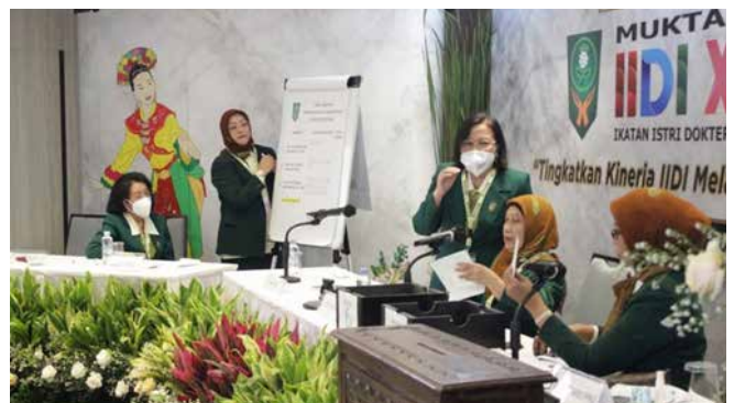
Penghitungan Surat Suara Pemilihan Ketua Umum Pengurus Besar IIDI Masa Bakti 2022 - 2025